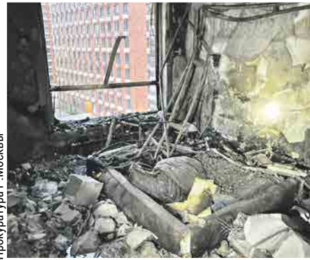
Прокуратура г. Москвы

Пожар полыхал в трёх квартирах на общей площади 100 «квадратов»: с пятого этажа огонь перекинулся в квартиру выше. Его тушили больше полутора часов. Позже при разборах завалов было обнаружено тело хозяина жилья, где был источник возгорания.