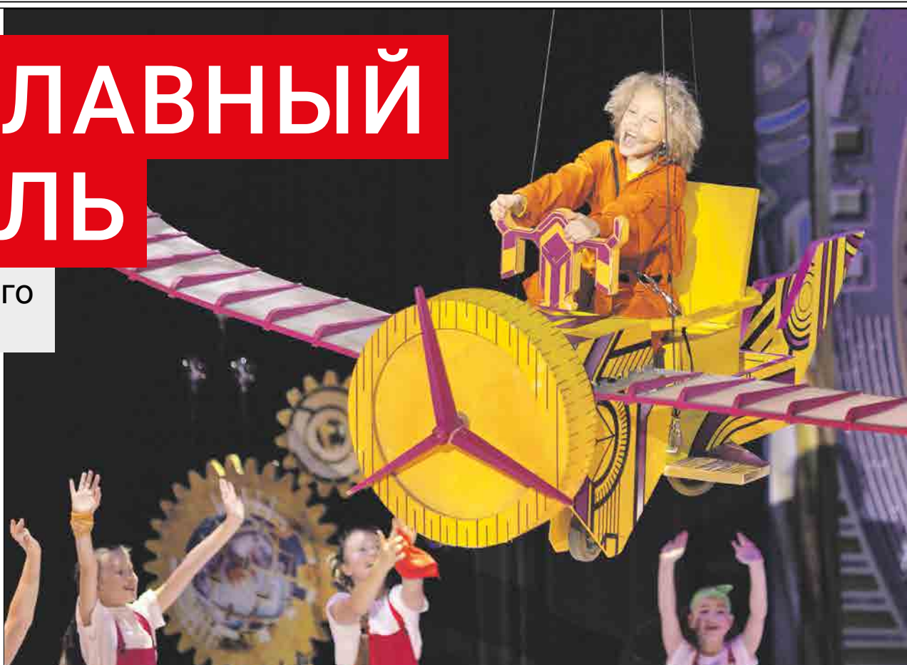
Наталья Лысых/Предоставлено Натальей Данько

— Мюзикл очень энергичный, и нужно успевать сразу всё — бегать, прыгать,