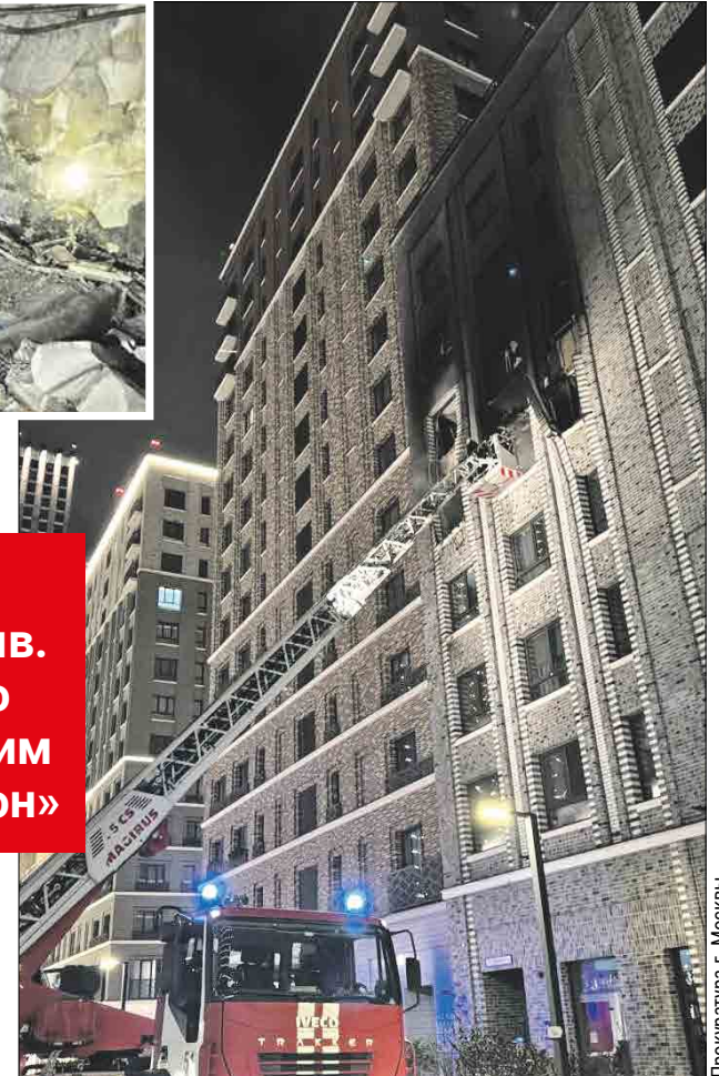
Прокуратура г. Москвы