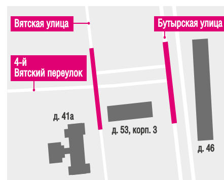
— ограничение движения

Все новости округа ежедневно на сайте severstolici.ru