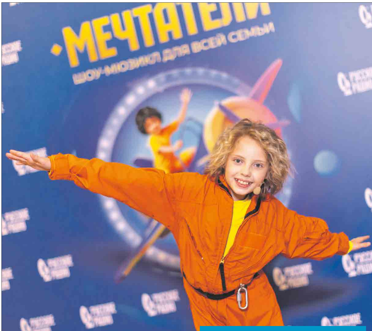
Наталья Лыских / Предоставлено Натальей Данько