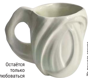
Остаётся только любоваться