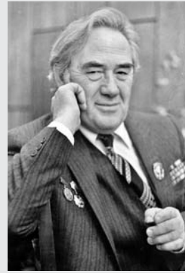
Из семейного архива