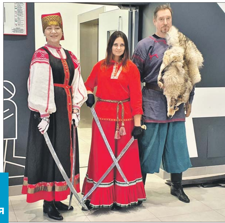
Женская фланкировка — завораживающее представление

— Любопытно, что фланкировка двумя клинками оказывает оздоравливающий эффект при некоторых заболеваниях, например при проблемах с позвоночником: ведь там идёт мягкая, равномерная нагрузка на весь опорно-двигательный аппарат, — говорит Алексеев. — Или применяется в качестве восстановительной гимнастики: я сам наблюдал, как пожилая женщина с шашкой в руках довольно быстро восстановила здоровье после инсульта. Новички тренируются на деревянных макетах шашки и только потом переходят на сталь. Но всё равно волноваться не надо: