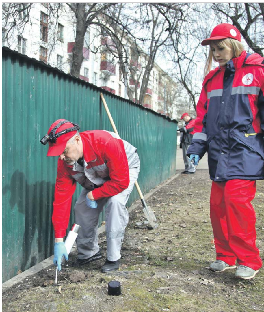
Обнаружили норку — и тут же залили её токсичной пеной