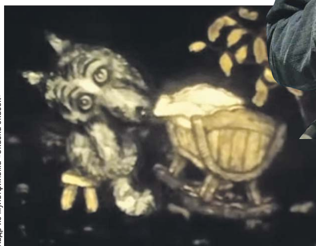
Кадр из мультфильма «Сказка сказок»

— Однажды на даче мы поругались с тещей на предмет воспитания нашего сына. На тот момент ей было 52 года. Она стала говорить, что она старая больная женщина, а я позволяю так с ней обращаться. Я сказал, что она не старая, а молодая и красивая. Она почему-то оскор-