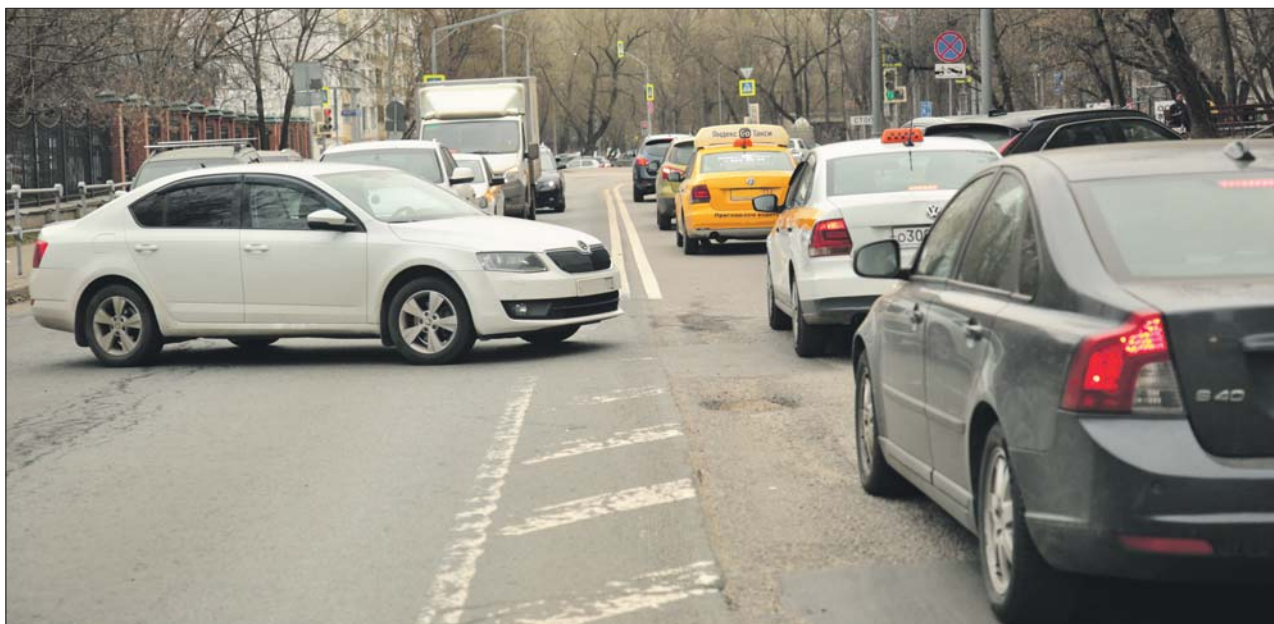
Когда разворот на этом месте отменят, Клинская должна поехать быстрее

На Клинской улице отменят опасный разворот