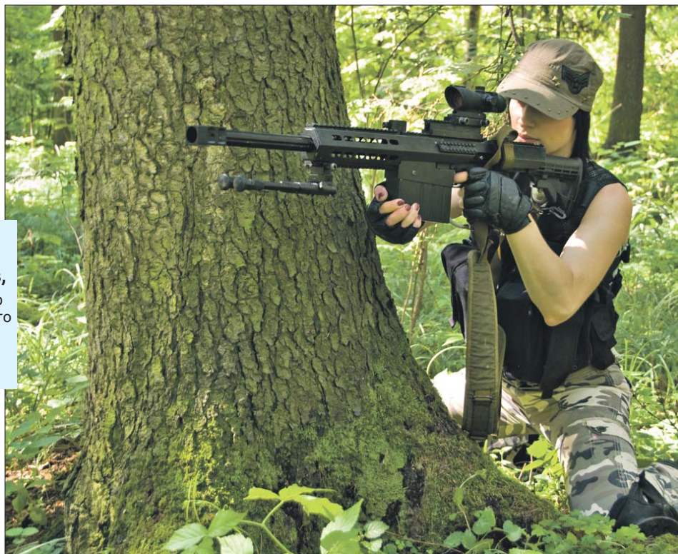
Страйкбол пришёлся по нраву любителям острых ощущений