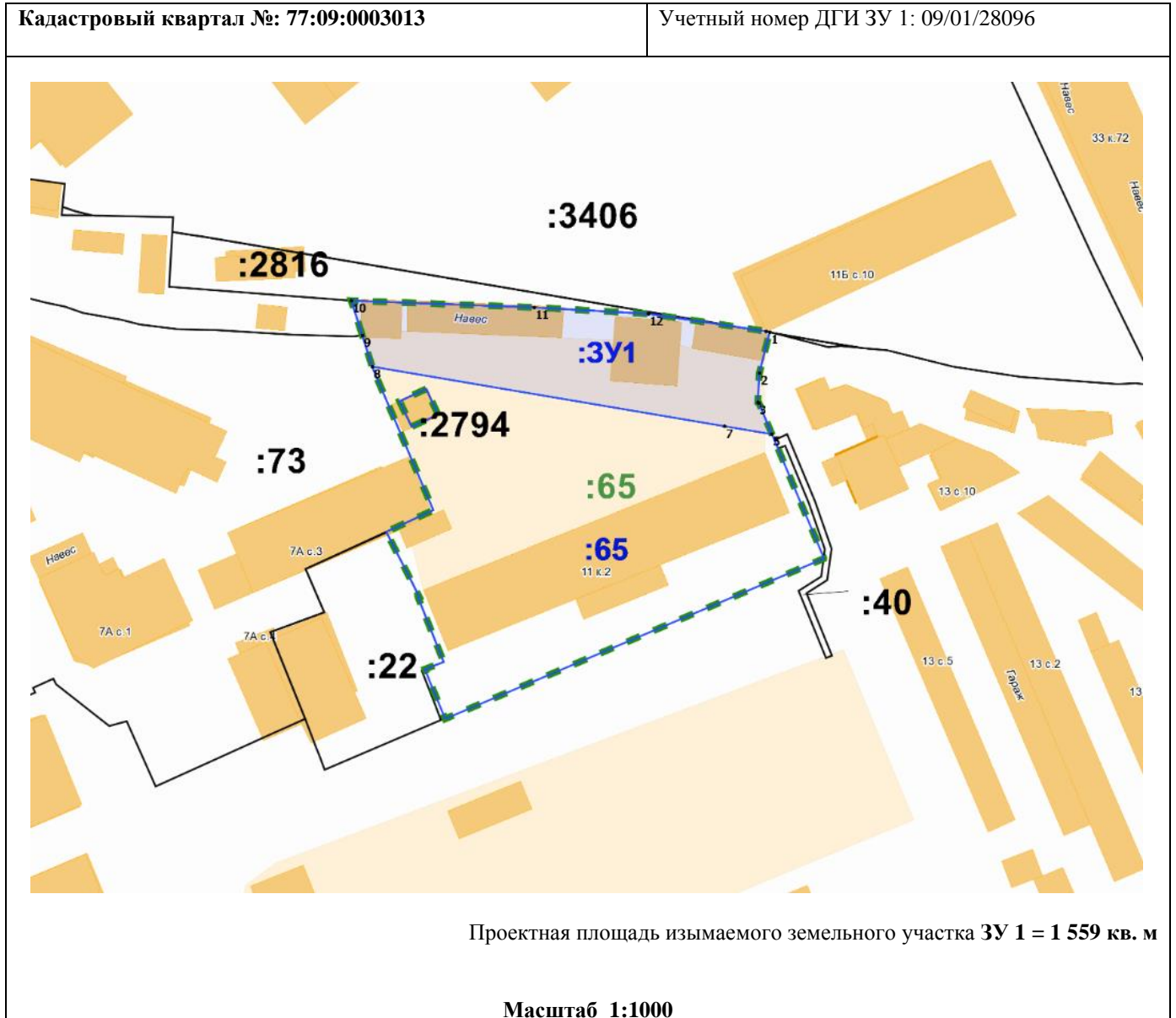
Схема расположения земельного участка на кадастровом плане территории: местоположение установлено относительно ориентира, расположенного в границах участка. Почтовый адрес ориентира: г. Москва, проезд Старопетровский, вл. 11, корпус 2

к Перечню объектов недвижимого имущества, подлежащих изъятию для государственных нужд