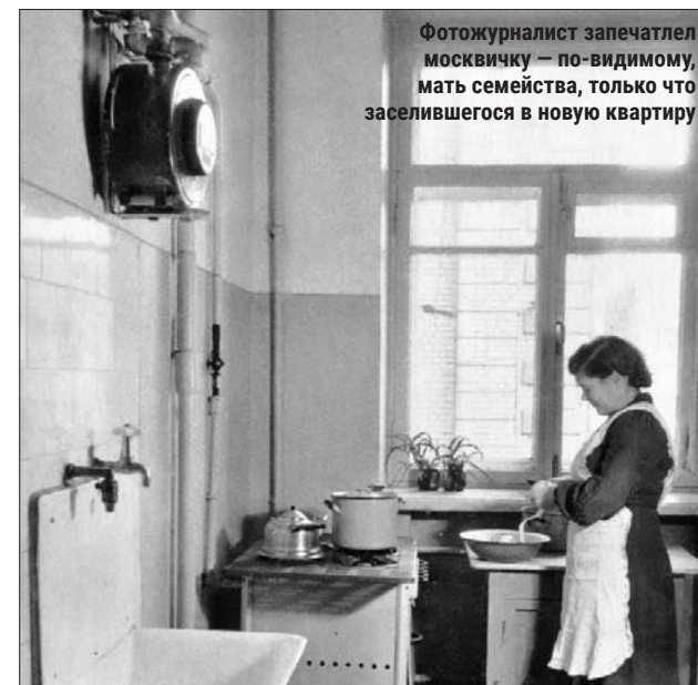
Фотожурналист запечатлел москвичку — по-видимому, мать семейства, только что заселившегося в новую квартиру