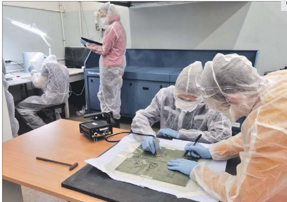
В колледже имени Годовикова практика начинается с 1-го курса