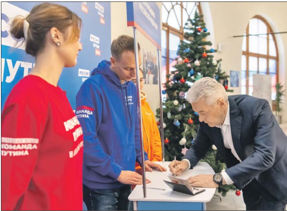
Выдвижение Владимира Путина поддержал и мэр Москвы Сергей Собянин

Также выдвижение Путина поддержал и мэр Москвы Сергей Собянин.