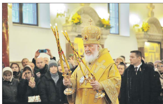
Патриарх поблагодарил всех, кто внёс вклад в строительство храма

— Ещё раз всех благодарю, мои дорогие, тех, кто потрудился, кто сегодня вместе со мной молился! Надеемся, что милость Божия будет пребывать с теми, кто к Богу возносит свои молитвы с верой и надеждой и кто в жизни совершает дела любви и миро-