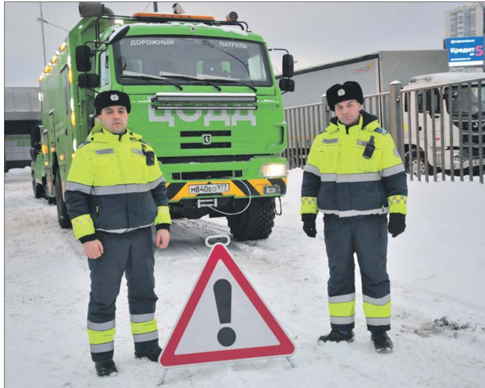
Оборудование КамАЗа позволяет и поднять перевернувшуюся легковушку, и вытащить из сугроба фуру

У «Дорожного патруля» появилась новая техника для помощи большегрузам на МКАД