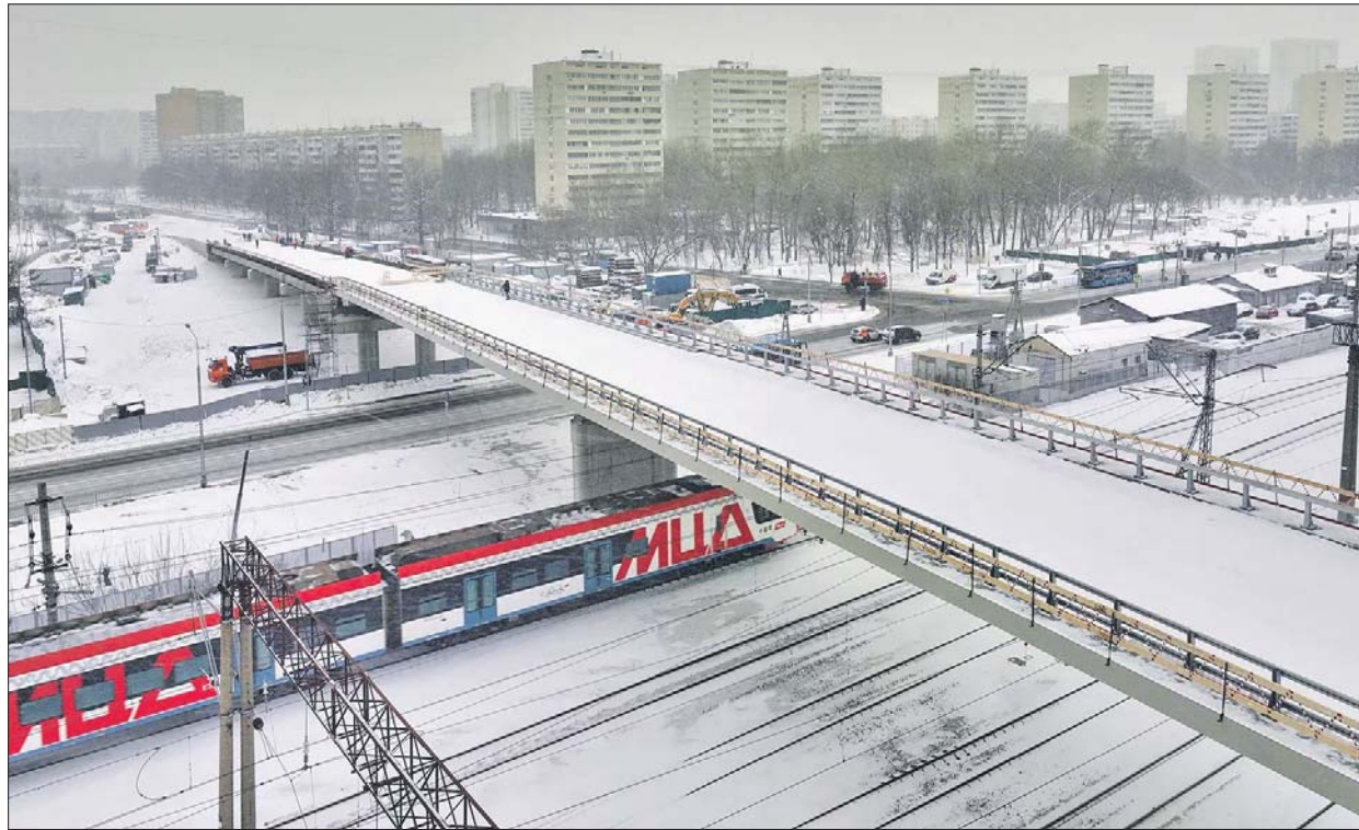
Путепровод через МЦД-1 около станции Бескудниково планируют достроить этим летом

На Керамическом проезде возле станции Бескудниково МЦД-1 обустроят отстой-