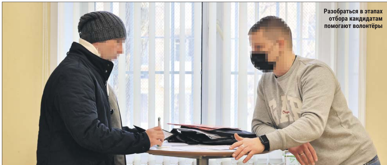
Разобраться в этапах отбора кандидатам помогают волонтеры

Контрактники перед отправкой в зону СВО проходят обязательное обучение