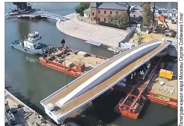
В центре Москвы появится ещё один маршрут для прогулок

«Постараемся в максимально короткие сроки выполнить отделку и открыть новый мост, который станет частью популярного прогулочного маршрута между парком Горького и ГЭС», — сообщил Собянин.