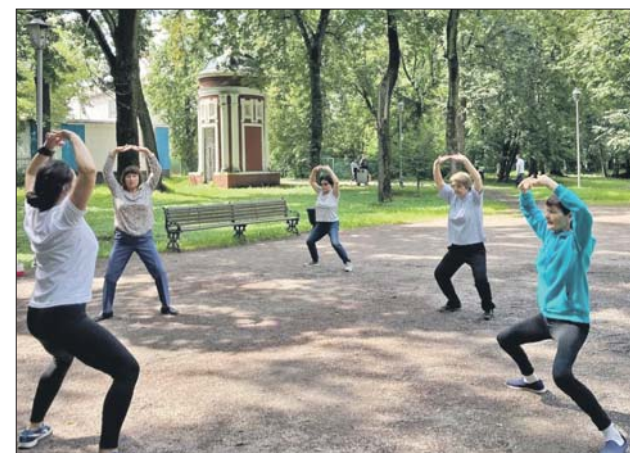
Движения в тайцзи медленные и мягкие

Адрес: парк Петра Алексеева (Михалковская ул., 38, площадка возле сцены). Запись по тел. (495) 870-4444