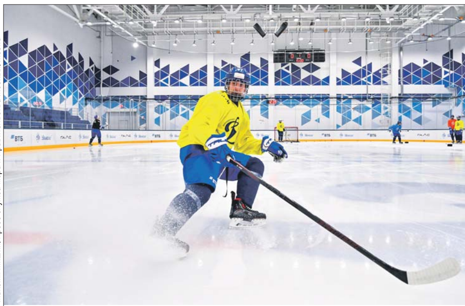
На ледовой арене уже начались тренировки динамовцев

Спортивно-тренировочный комплекс на ул. Юрия Никулина, 3, начали строить в июне 2021 года. Работы шли за счёт инвестора.