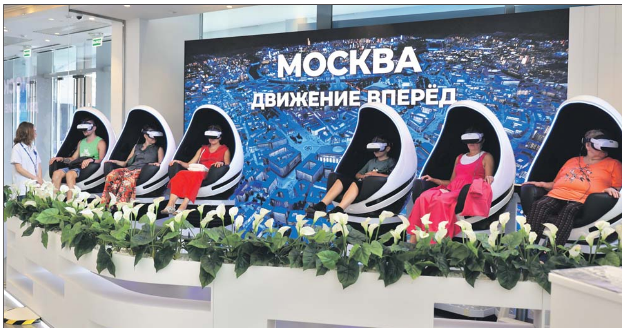
В «Зарядье» гости форума могли виртуально полетать над столицей