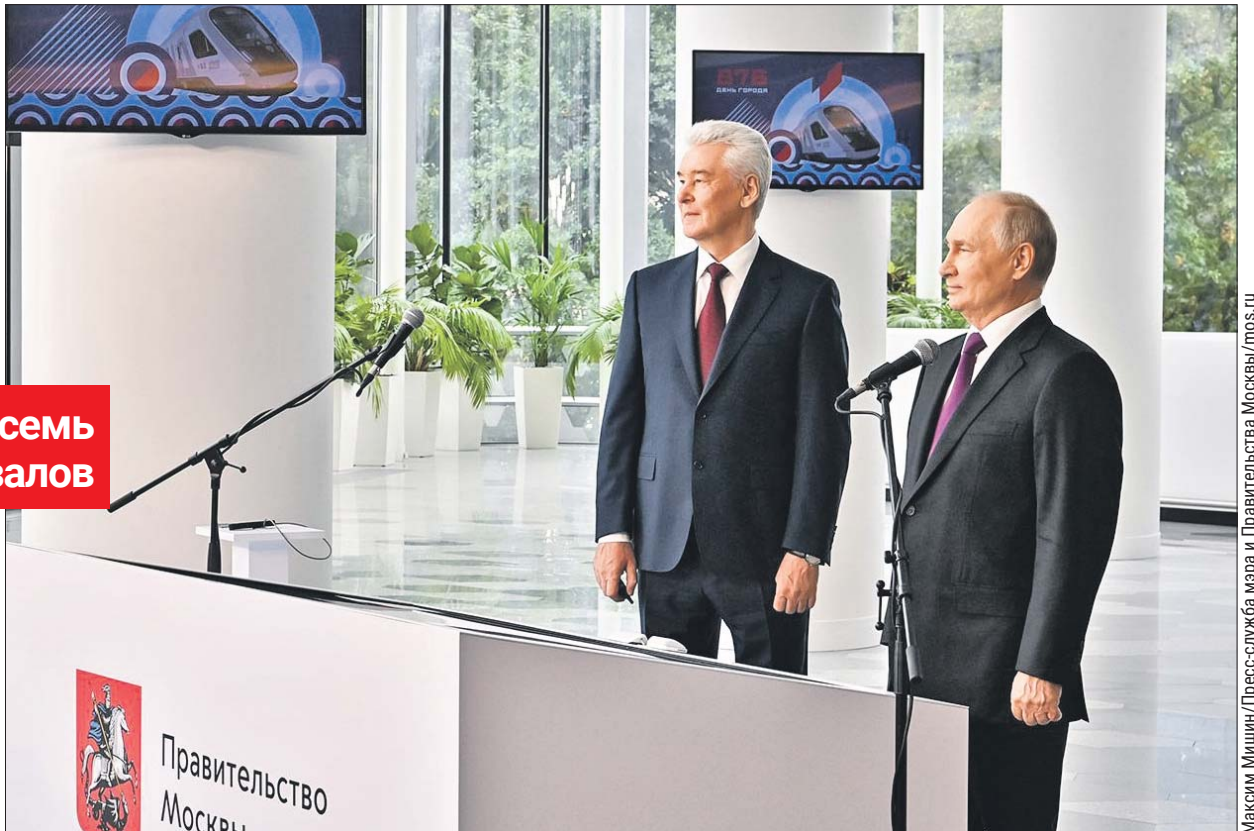
В запуске маршрута приняли участие президент Владимир Путин и мэр Сергей Собянин

ездки — 50 рублей. «Пригород» — от станции Апрелька до Лесного Городка и от Никольского до Железнодорожной. Проезд стоит 65 рублей. «Дальняя» — от станции Нара до Дачной и от Чёрного до Крутого. Стоимость поездки — 65 рублей плюс 30 рублей за каждую зону за пределами «Пригорода».