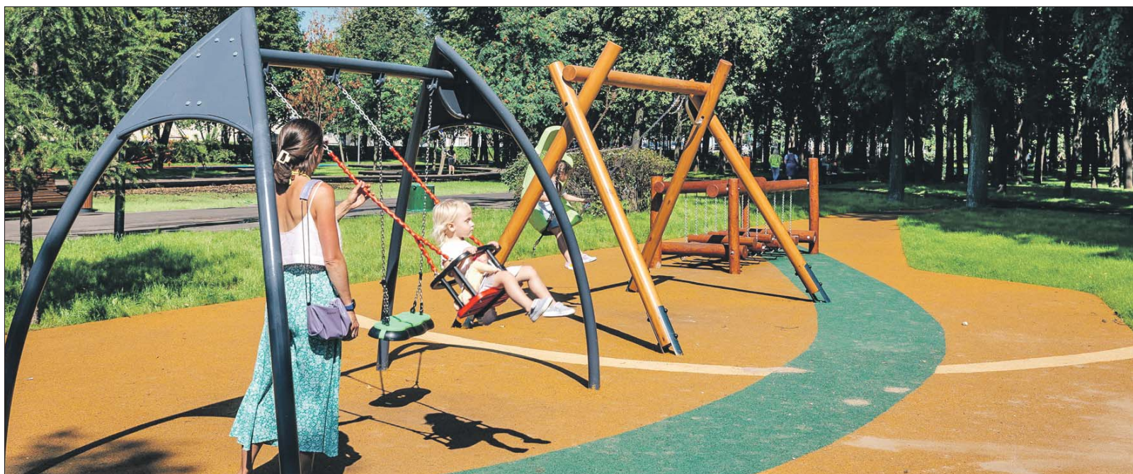
Сайт мэра Москвы Сергея Собянина sobyanin.ru

В районе Западное Дегунино привели в порядок сквер на Базовской улице. По нему жители идут к станции Грачёвская МЦД-3, и теперь тут есть новые фонари, пешеходные и велосипедные дорожки, спортивные площадки и места для отдыха, детские площадки, а также две площадки для выгула собак.