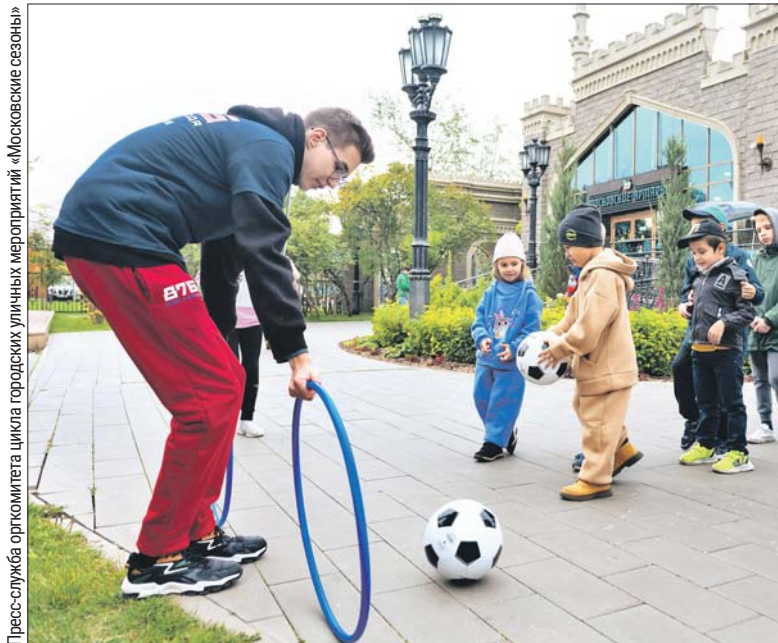
На фестивальной площадке в Коптеве развлекали как взрослых, так и самых маленьких гостей

ге, драг-рейсинге, — рассказали в пресс-службе проекта «Московские сезоны». — Кроме того, взрослые и дети старше восьми лет проверяли, кто самый быстрый и сильный на наших соревнованиях. Участники приседали, отжимались, прыгали через скакалки, качали пресс и ма-