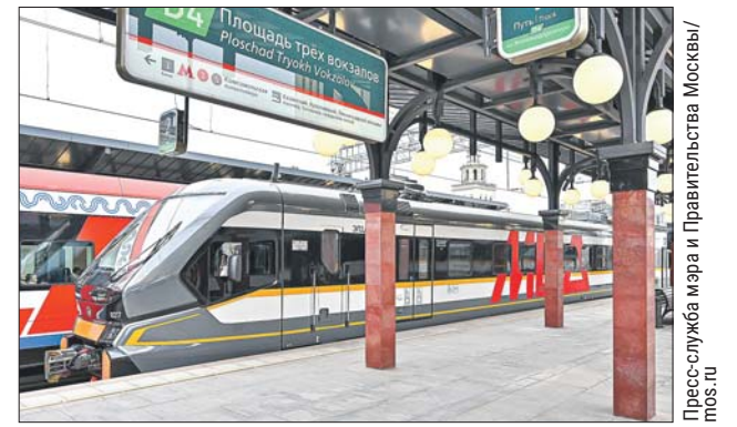
Как и другие диаметры, МЦД-4 обслуживают современные поезда