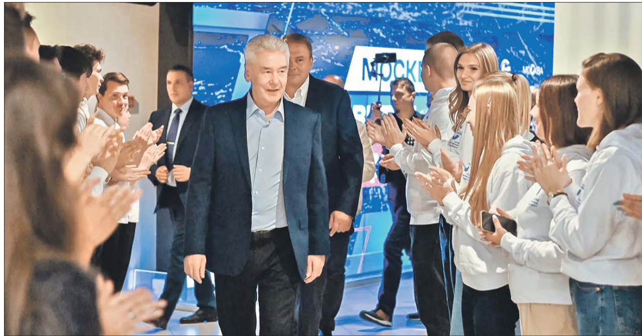
Сергея Собянина поддержали почти 77% избирателей

«Спасибо, дорогие мои, за поддержку. Несмотря на огромный путь созидания, который мы вместе прошли, впереди большая, трудная, сложная, но очень важная работа для страны, для города, для москвичей. Я сделаю всё, чтобы наш город стал ещё круче и краше. Нам это точно по плечу. Потому что у нас есть самое ценное в этом мире — мужественные,