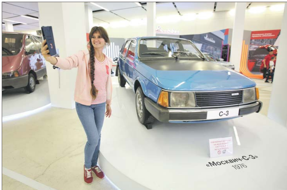
Экспериментальные модели «Москвича» прошлых лет показали в Манеже

Четыре площадки посетили больше 7,5 миллиона человек