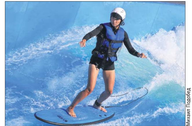
В «Лужниках» проходили бесплатные тренировки по сёрфингу

Здесь прошли три крупных симпозиума: 3-й Международный конгресс Urban Health о трансформации Москвы, 1-й Все-