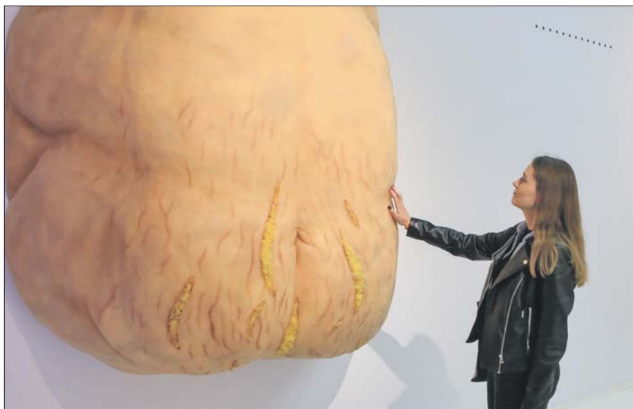
В музее вредных привычек показаны последствия переедания