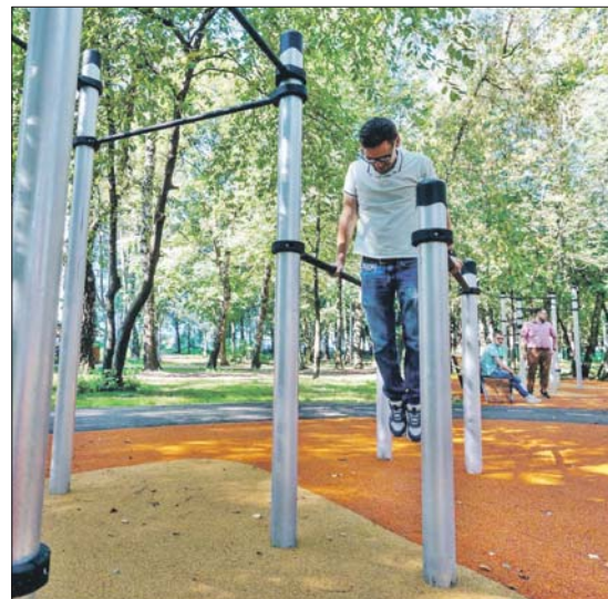
В сквере оборудованы новые детские и спортивные площадки

Завершено благоустройство сквера на Базовской улице. Рядом жилые кварталы, поликлиника; через сквер многие идут к платформе Грачёвская.