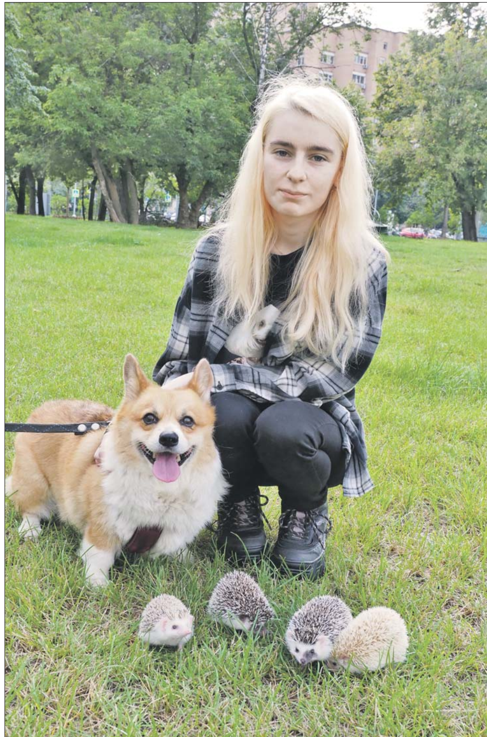
Ёжиков на прогулке и дома охраняет корги Алиса