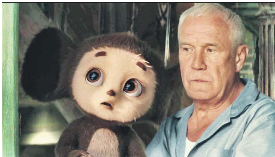
Современные дети знают актёра по роли садовника Гены в семейной комедии «Чебурашка»

— А помните какие-то особенные подарки из детства?