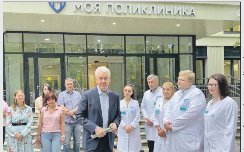
Мэр во время посещения поликлиники на улице Немчинова 26 июля 2023 года

В первых 40 поликлиниках работы уже начинаются. По словам мэра столицы, полное обновление поликлиник постараются закончить в течение двух лет — до конца 2025 года.