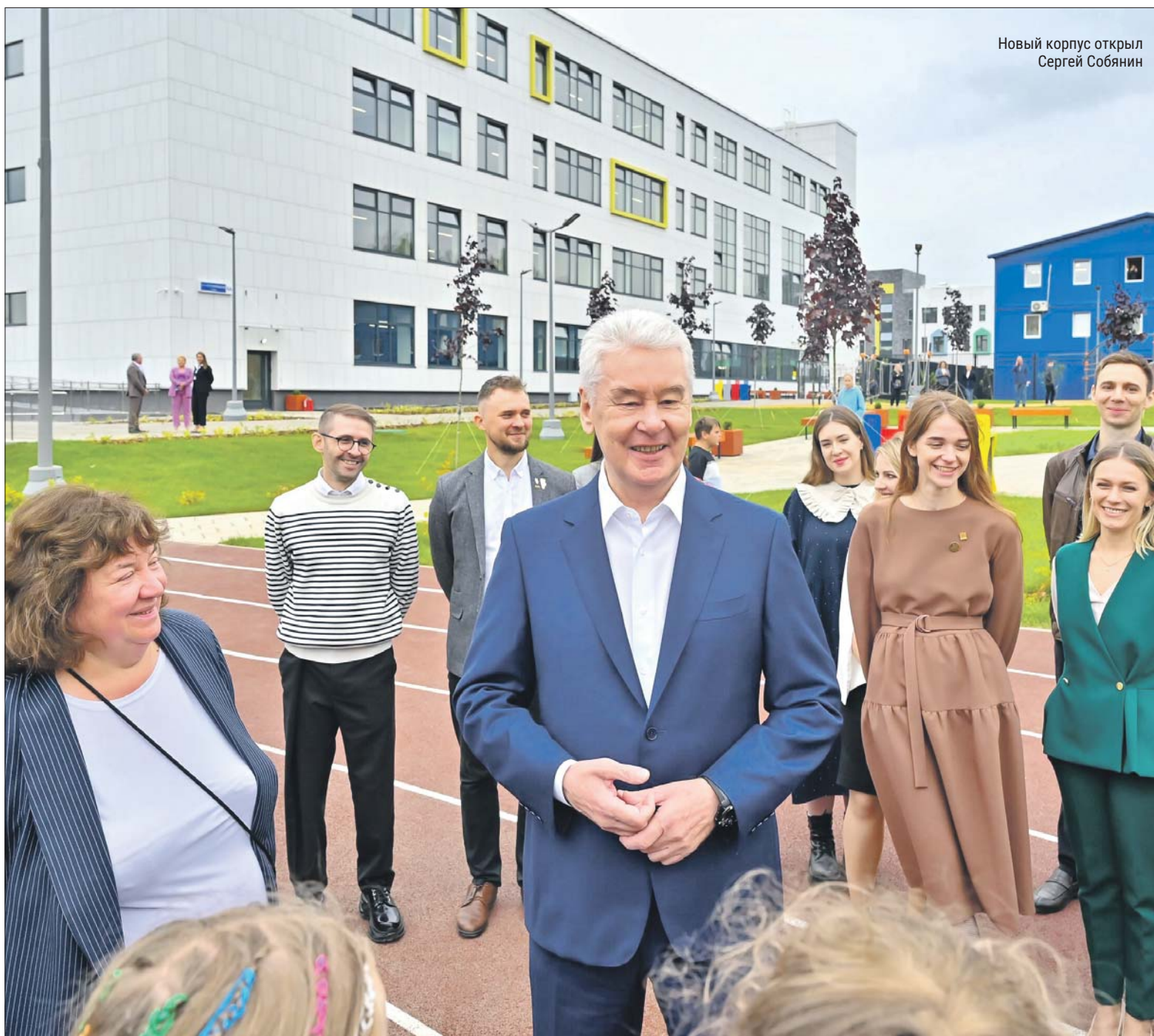
Новый корпус открыл Сергей Собянин