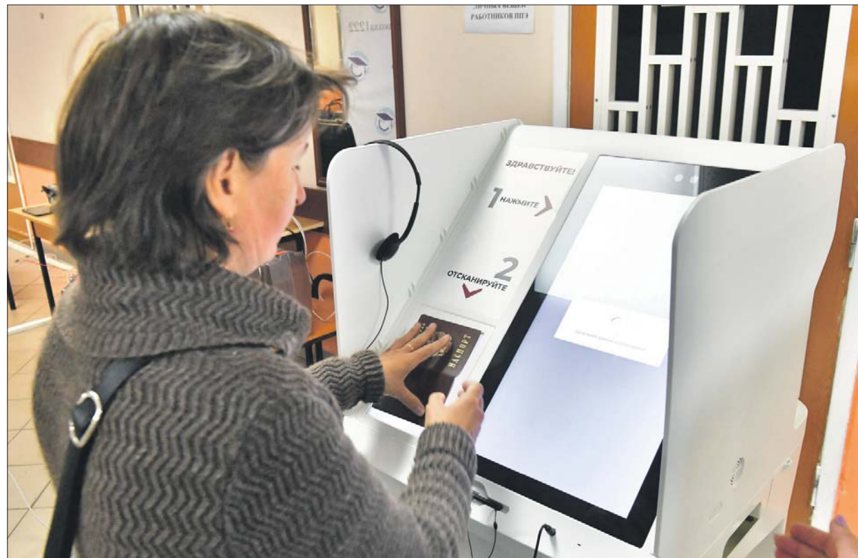
Тестовое голосование проводилось в условиях, максимально приближенных к реальным выборам