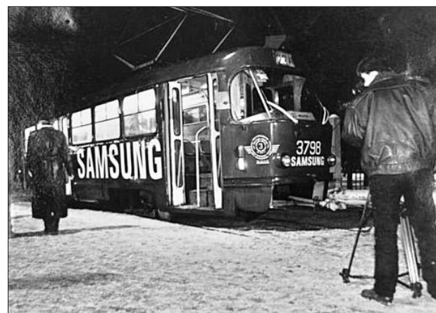
По горячим следам найти стрелявшего не удалось. Архивное фото 1998 года