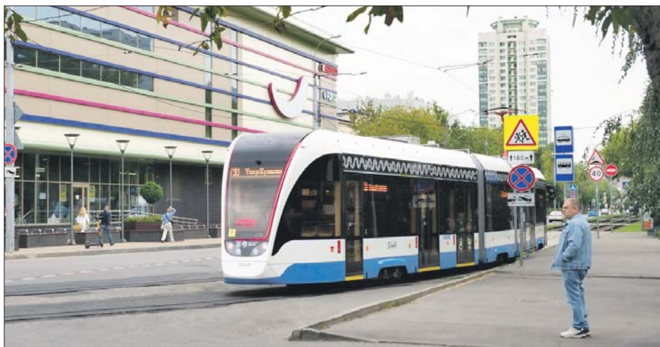
Так сейчас выглядит место, где произошла трагедия