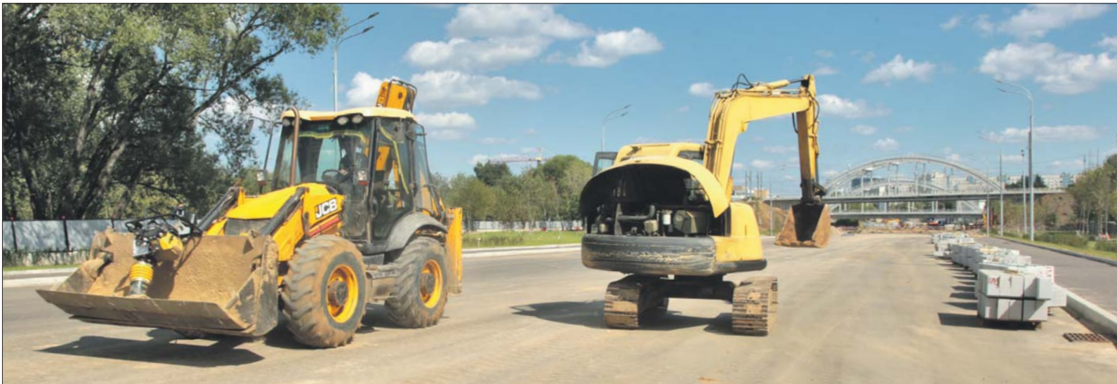
На новой дороге осталось уложить верхний слой асфальта, нанести разметку

С Дубнинской можно будет за считанные минуты попасть на улицу Хачатуряна