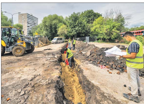
Работы планируют завершить до конца 2023 года