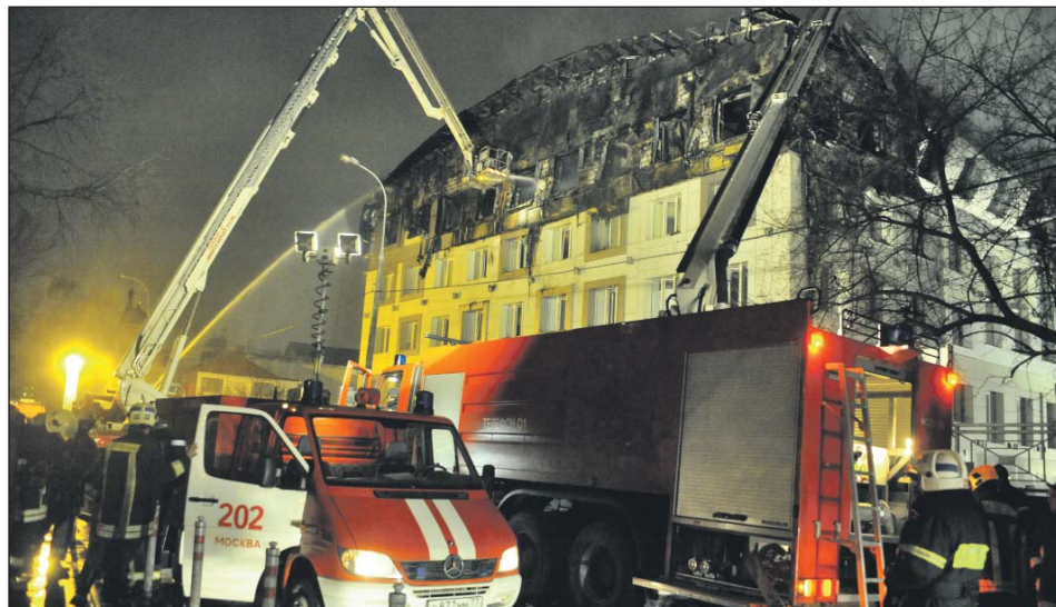
Евгений Чернышёв вернулся в горящее здание, и там обрушилась кровля