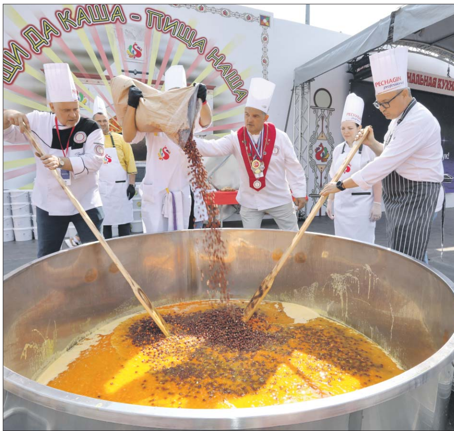
Одной только перловки понадобилось 250 кило