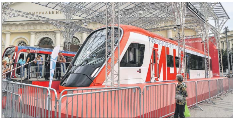
У входа в Манеж представлен современный московский транспорт

гие, где есть вакансии для тех, кто хочет связать свою карьеру с московским транспортом.