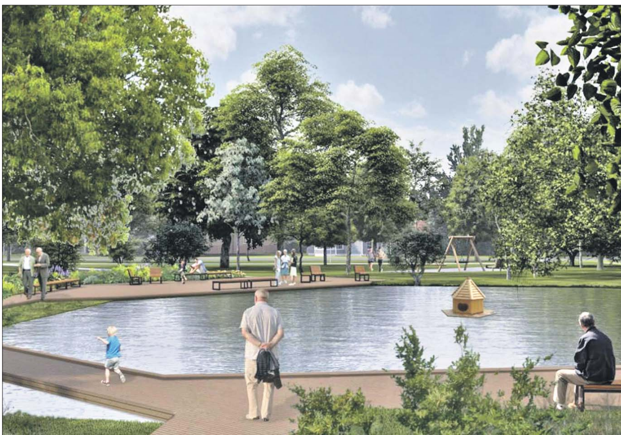
Сайт мэра Москвы Сергея Собянина sobyanin.ru

В самом удалённом от центра районе САО теперь есть школа, поликлиника и быстрые поезда