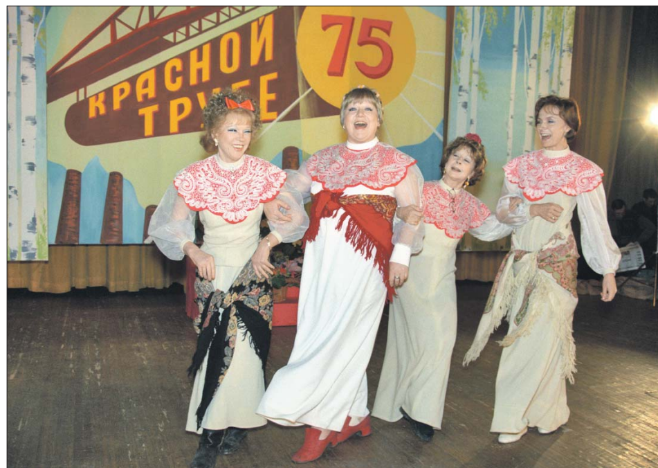
Четыре подруги в исполнении Людмилы Гурченко, Светланы Крючковой, Лии Ахеджаковой и Ирины Купченко выступают на концерте в честь юбилея завода «Красная труба»

Дом культуры «Правда» (ул. Правды, 21, стр. 1) также можно увидеть в нескольких фильмах. Например, в киноленте Станислава Говорухина «Место встречи изменить нельзя» (1979) на крыльце клуба Володя Шарاپов ждал Варю Синичкину. А в 1999 году Эльдар Рязанов снимал здесь сцены своей комедии «Старые клячи».