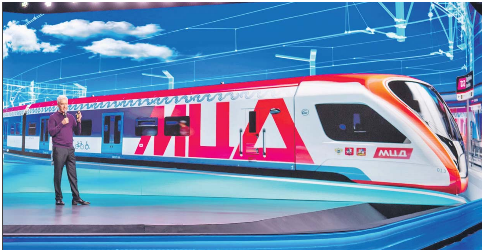
Сергей Собянин: Москва по праву считается крупнейшим центром высокотехнологичной промышленности России

— Москва — крупнейший транспортный узел. Через него проходит большая часть потоков — железнодорожных, авиационных, автомобильных. И от развития