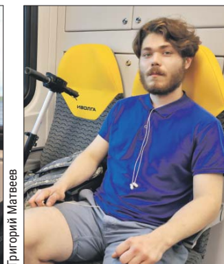
200 рублей на всю поездку в кассе или в автомате. Можно купить бумажный билетик, но по карте «Тройка» можно прилично сэкономить.