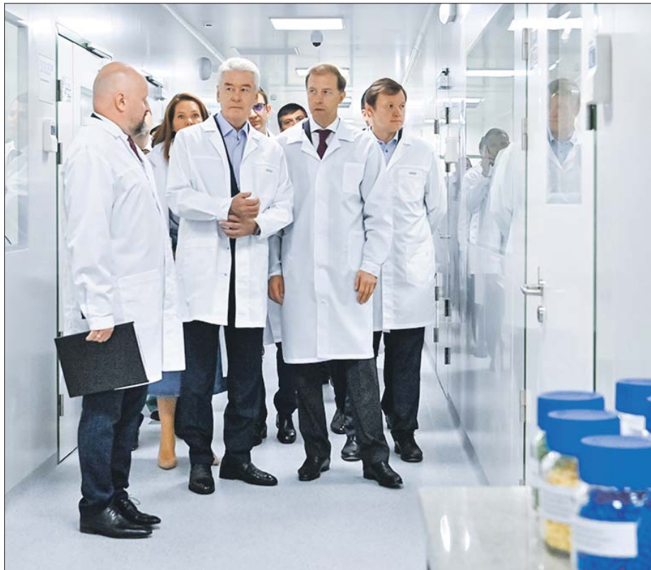
Предприятие открыли Денис Мантуров и Сергей Собянин

Москва — один из крупнейших производителей лекарств и медицинских изделий в России. Столичные фармпредприятия производят лекарства для лечения и профилактики онкологических и сердечно-сосудистых заболеваний, расстройств нервной системы, сахарного диабета, а также обезболивающие, антибиотики, вакцины. Ведущие производства находятся в Зелено-