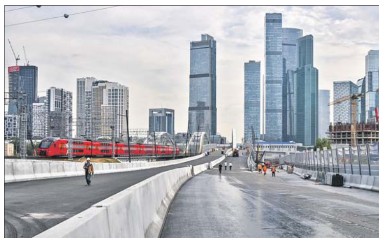
На трассе расположили две эстакады основного хода

В проекте «Активный гражданин» началось голосование за название новой магистрали. Среди предложенных вариантов — проспект Багратиона, Одинцовское шоссе и Деловой проспект.