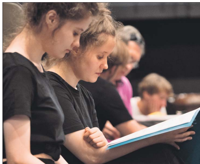
Начало работы над спектаклем — читка сценария

Адрес: Ленинградский просп., 71г. Сайт: teatrcdr.ru