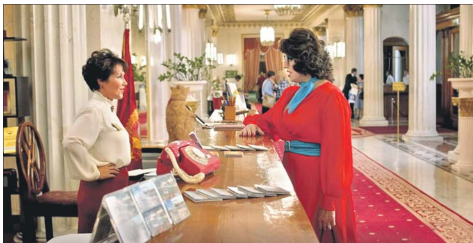
В отеле «Советский» снимали комедию «Прабабушка лёгкого поведения. Начало»