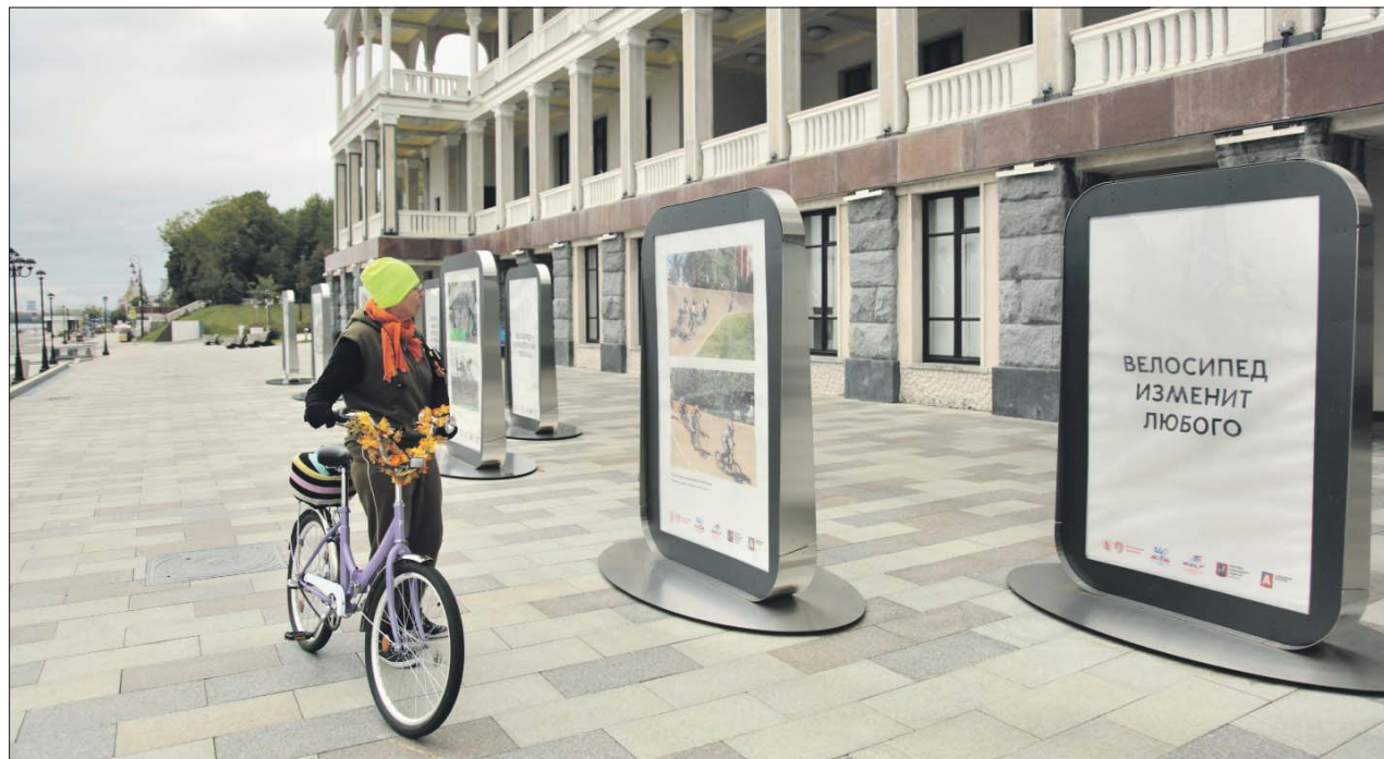
На 33 фотографиях представлена история отечественного велоспорта с 1930-х годов

— Среди представленных снимков есть фотографии 1930 года, на которых запечатлены пионеры, катающиеся на велосипедах в школьном дворе, и велосипедисты, едущие по Красной площади, — рассказали в пресс-службе Федерации велосипедного спорта России.