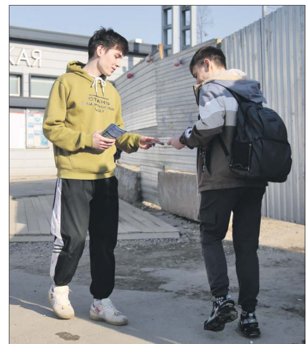
Волонтеры раздают брошюры о контрактной системе