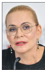
Владимир Астапович / РИА Новости