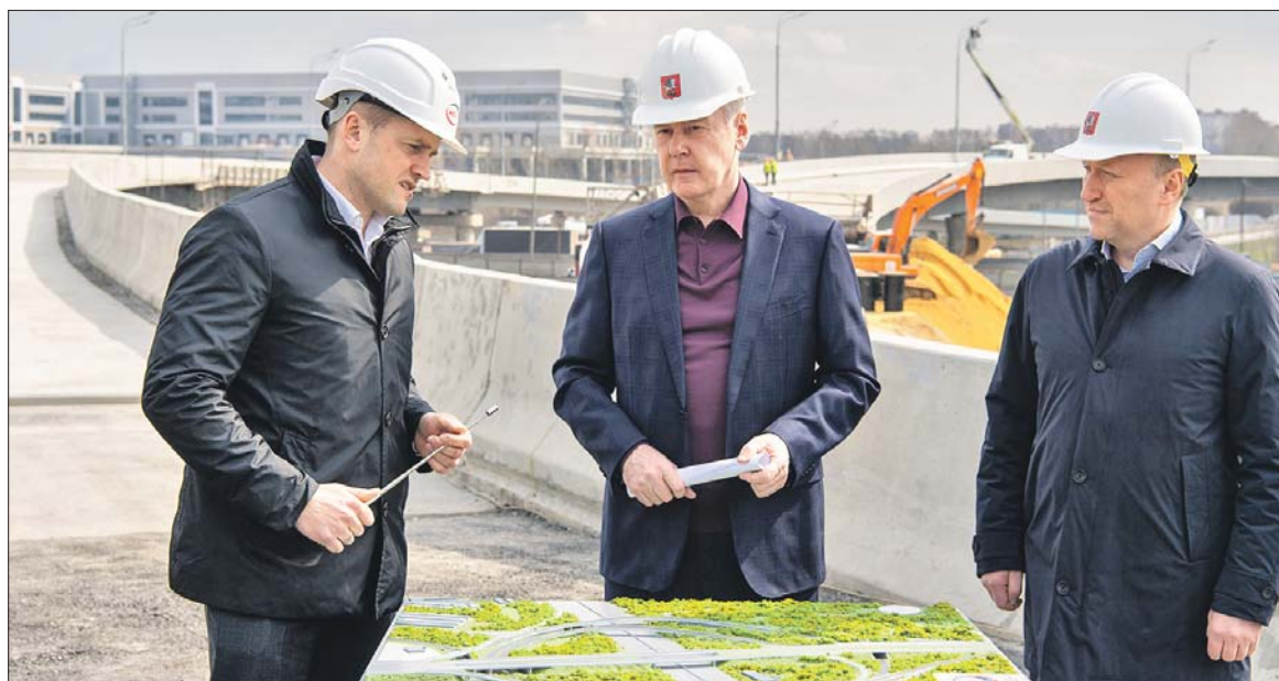
Сергей Собянин во время посещения строительной площадки на МКАД

Реконструкция развязки началась в мае 2021 года. Проект предусматривает замену устаревшего сооружения на современное, с направленными съездами. Параллельно идёт реконструкция МКАД между 26-м и 31-м километрами — участка от будущего МСД до Каширского шоссе.