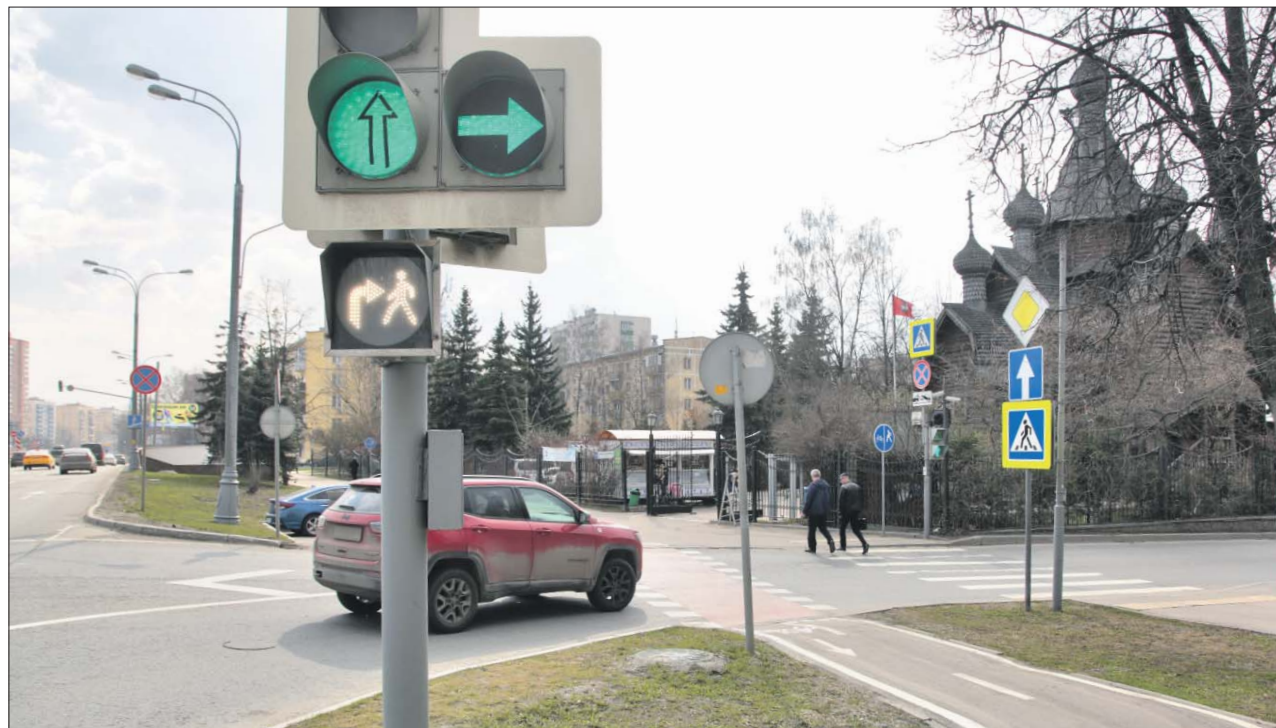
Мигающий человечек появился на пересечении Большой Академической и Коптевского бульвара

Знаки платной парковки хорошо чистят — их видно даже в непогоду