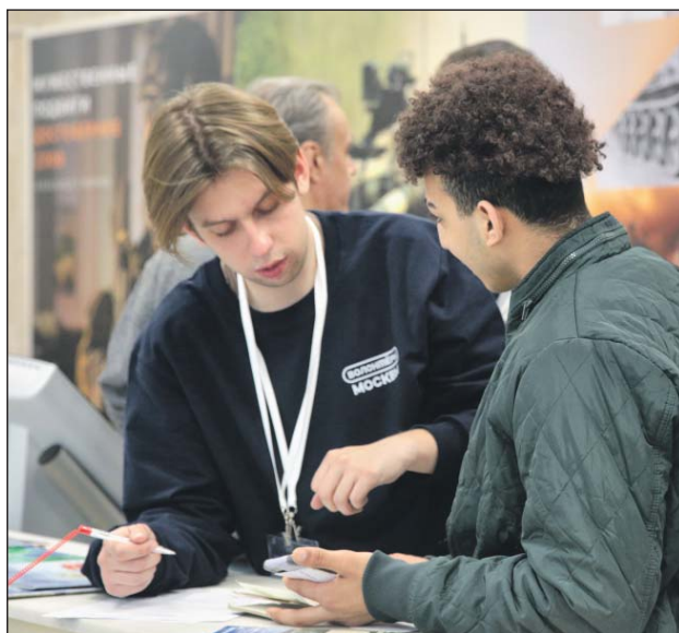
Ежедневно пункт посещают до сотни человек

Заполнив анкету, кандидаты на контрактную службу ждут вызова для проверки документов. Буквально через несколько минут на табло появляется номер окошка, к которому нужно подойти. Дальше приглашают на осмотр к врачам. Затем — на профессионально-психологический отбор и собеседование с представителями Министерства обороны РФ. Они рекомендуют, в какое подразделение стоит направить кандидата. Сейчас особенно нужны разведчики, артиллеристы, танкисты. Подготовку перед отправкой в зону СВО контрактники проходят на полигонах Подмосковья.