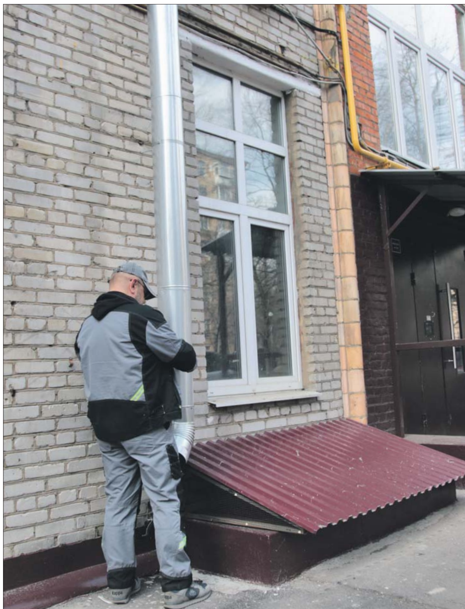
Водостоки в доме на Алабяна привели в порядок

Осенью же регулярно возникают засоры из-за