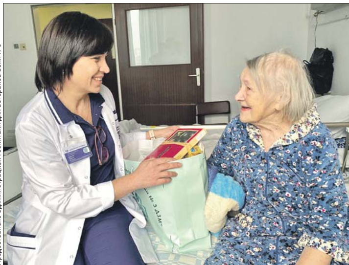
Лидия Сергеевна не утратила интереса к жизни и людям