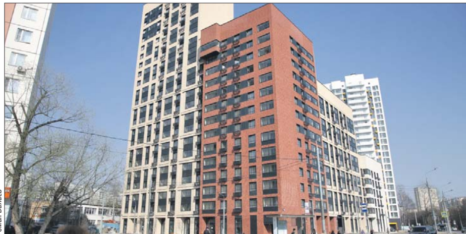
Вскоре сюда начнут переезжать семьи из окрестных пятиэтажек