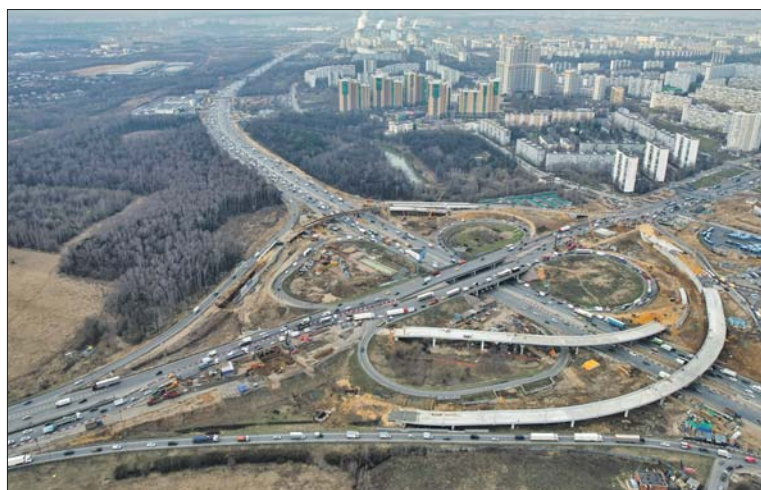
На развязке сделают четыре новых съезда

Реконструкция Липецкой развязки позволит обеспечить беспрепятственный выезд на федеральную