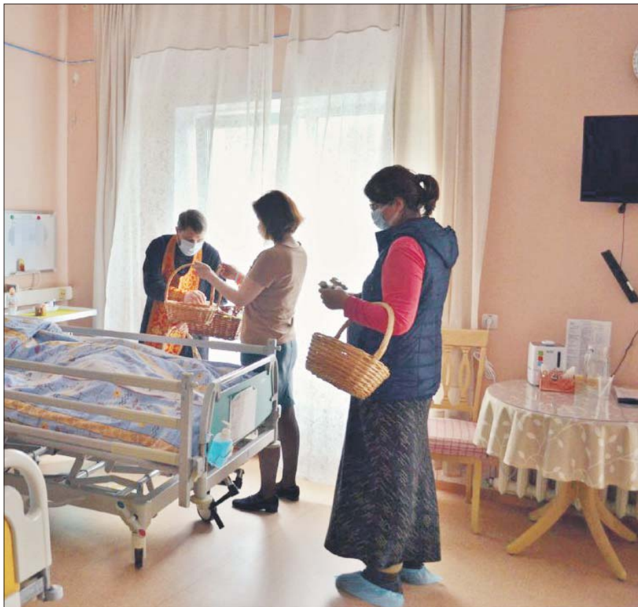
В хосписе стараются создать домашнюю атмосферу

— Для подопечных хосписов очень важны простые вещи, как, впро-