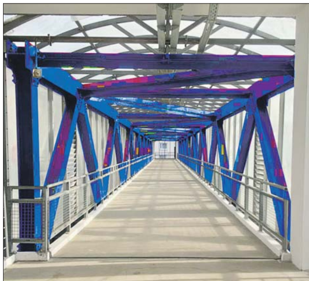
Воспитанники детского технопарка предлагают свои варианты оформления

Стали проводить опросы на улицах, собирать