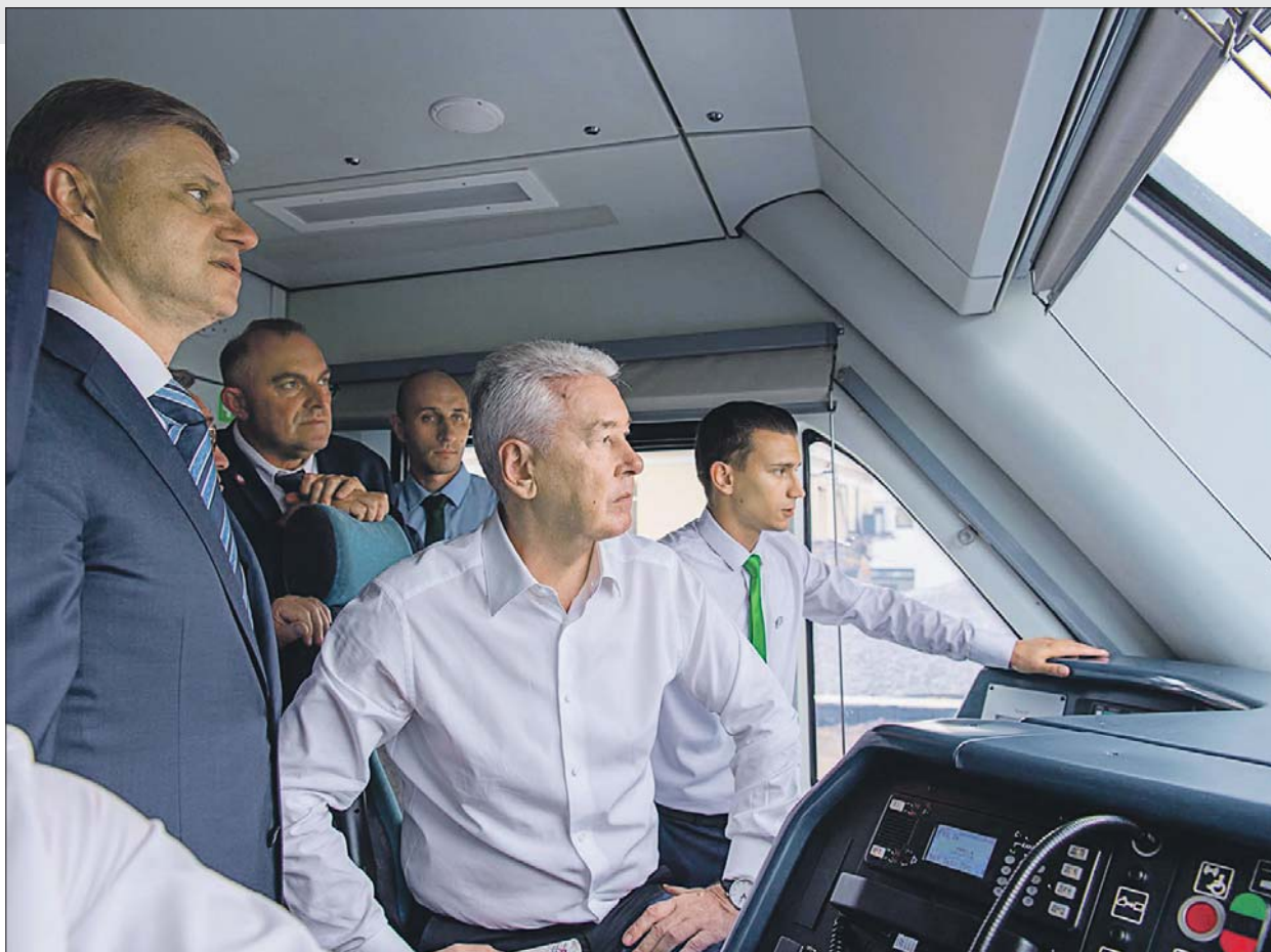
Сергей Собянин назвал реконструкцию путей трудным, но важным этапом

Поезда на втором диаметре теперь идут с интервалом шесть минут