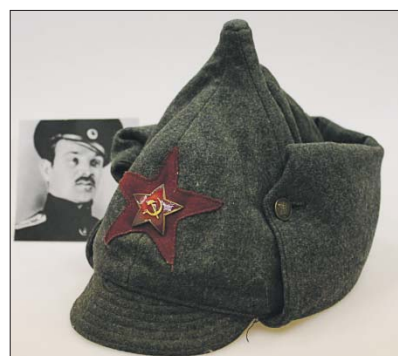
Та самая будёновка автора «Прощания славянки»