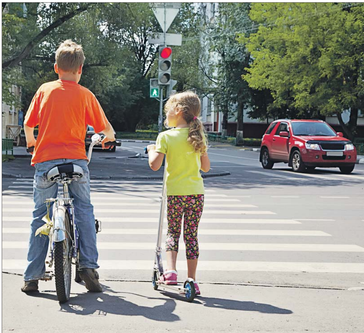
Дети, вернувшиеся с отдыха, забывают, что в мегаполисе нужно быть начеку

Так, недавно около 7 часов вечера тринадцатилетняя девочка ехала на самокате по двору дома 11, корп. 3, на Синявинской улице. подро-