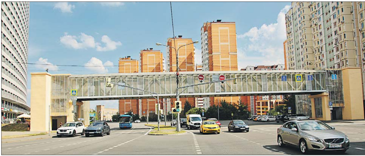
Переход отлично подойдёт для того, чтобы укрыться от дождя, сыграть на гитаре, пообщаться

Пешеходный мост на Гризодубовой предлагают превратить в творческое пространство