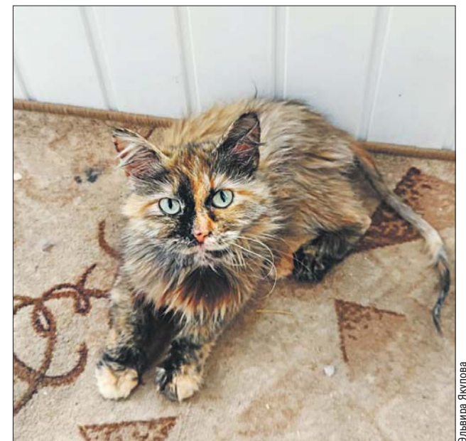
Кася — умная кошка, ласковая, но ненавязчивая