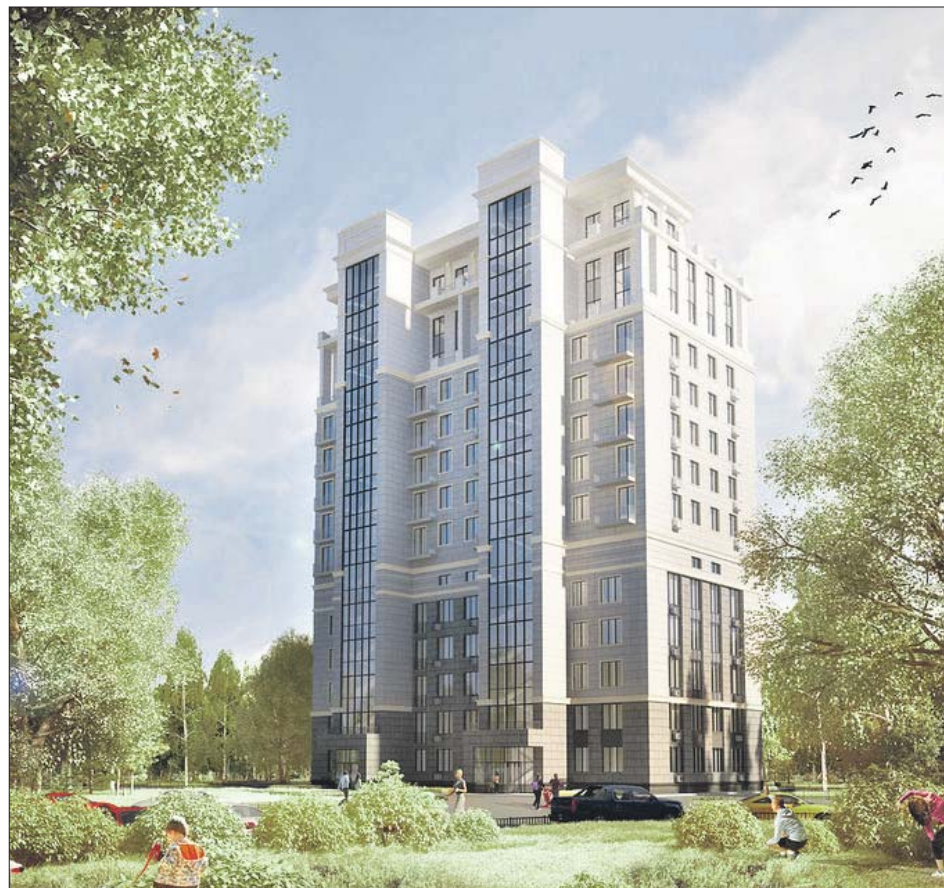
Дом будет выглядеть более современным снаружи, обновят его и внутри

Когда закончатся работы, преобразится не только сам дом, но и двор. Территорию огородят, чтобы не было посторонних, поставят лавочки, обустроят три десятка парковочных мест для стоянки авто. Планируют по-