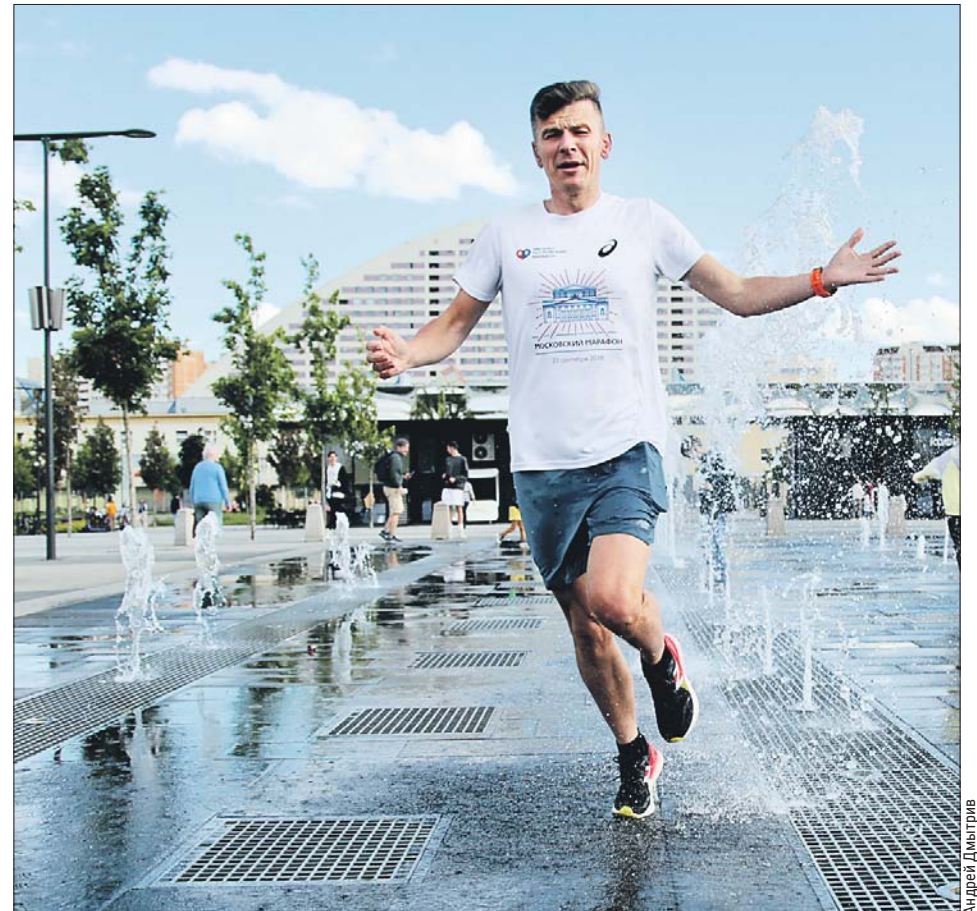
Можно пробежать прямо через «сухой» фонтан, полностью вымокнув и освежившись

Как рассказал Пётр, заниматься спортом следует в одежде из специальных синтетических тканей. — Хлопок задерживает