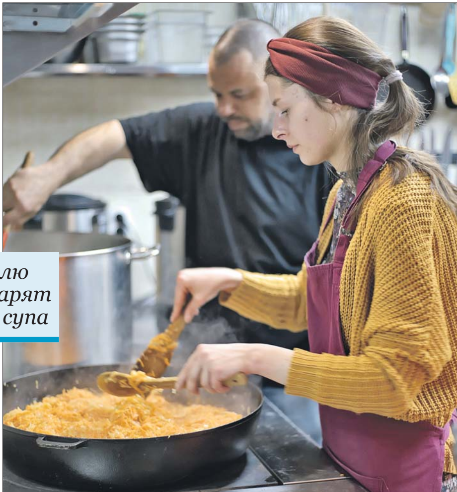
Приготовленную еду затем раздают бездомным на вокзалах

Для бездомных нужны сезонная одежда и обувь, можно и не новые, но чистые и с рабочими молниями и застёжками. В дефиците мужская