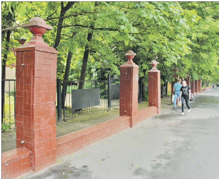
Жителей района Аэропорт удивило, что на Часовой улице сняли секции весьма основательного ограждения

Ирину из района Аэропорт удивило, что забор снимают даже на Часовой улице — это основательное ограждение с кирпичными опорами, к тому же ограждение есть в паспорте двора.