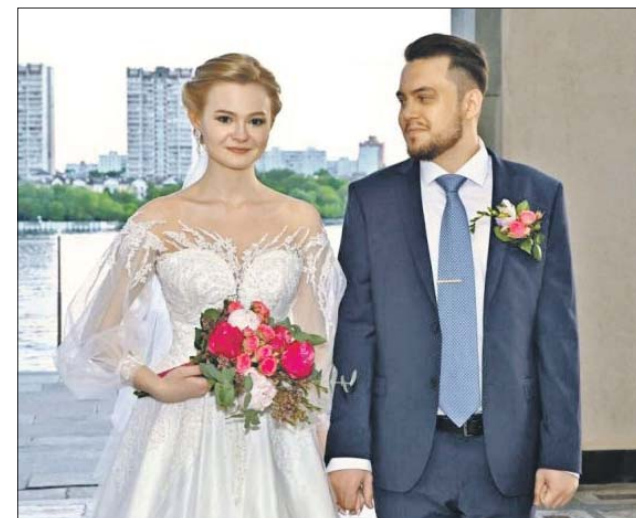
Пресс-служба Департамента транспорта г. Москвы