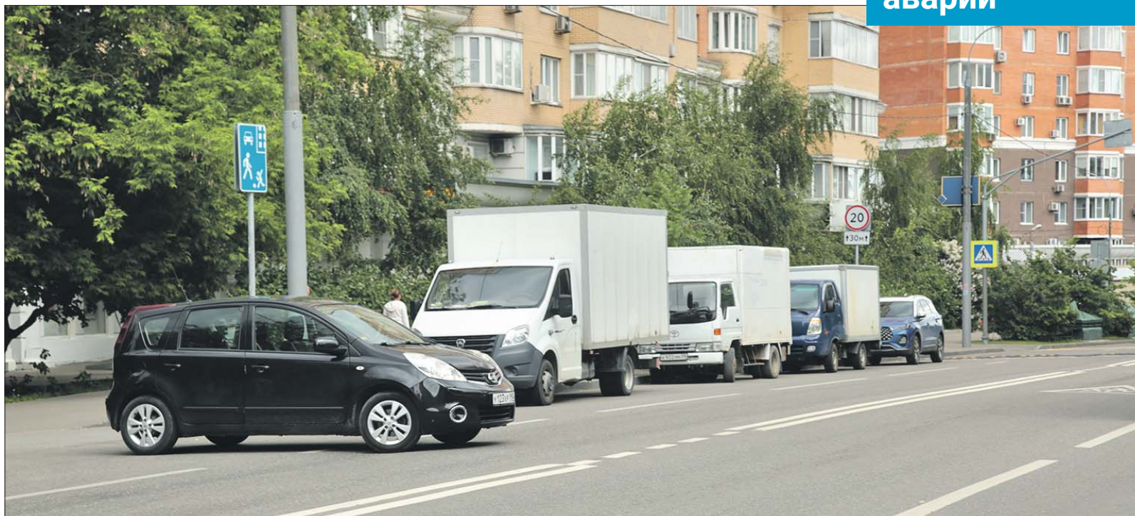
Из-за припаркованных грузовиков выезжающим со двора не видно, что происходит на проезжей части

Нужны карманы для парковки, чтобы не было аварий