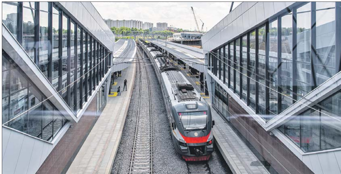
Новая станция наземного метро расположена на перегоне между станциями Люблино и Текстильщики Курского направления