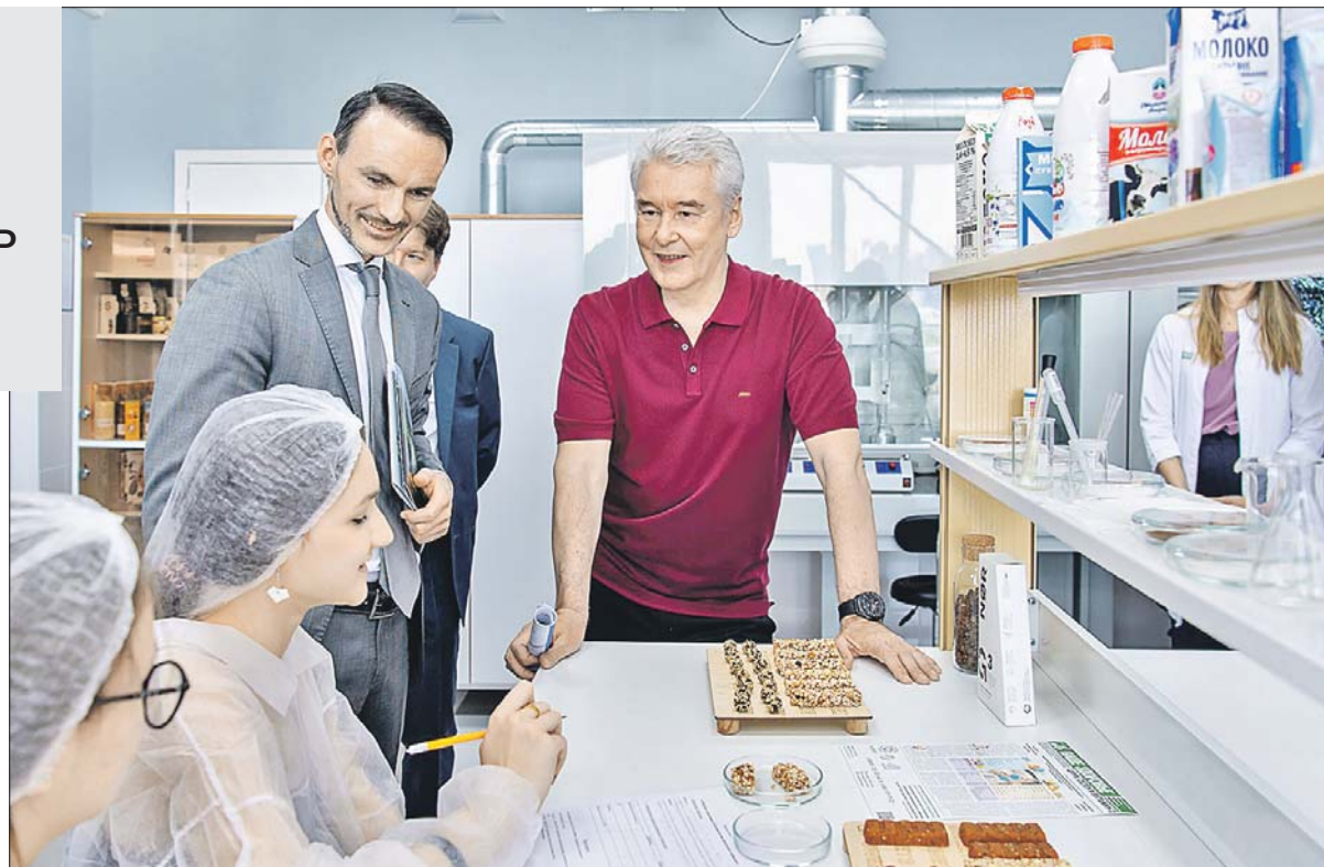
Сергей Собянин уверен, что в детском технопарке будет интересно

МГУПП предоставил технопарку помещения, город помог с оснащением лабораторий, выделив из бюджета субсидию в размере 51 млн рублей. Например, в лаборатории сити-фермерства