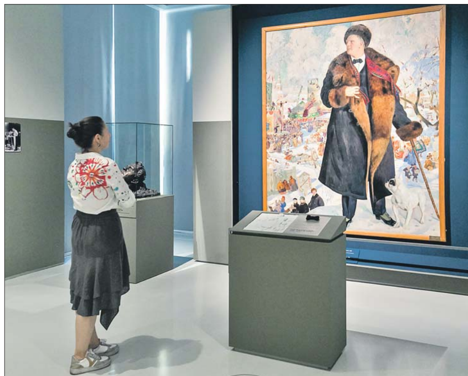
Один из центральных экспонатов проекта — портрет Фёдора Шалапина кисти Бориса Кустодиева