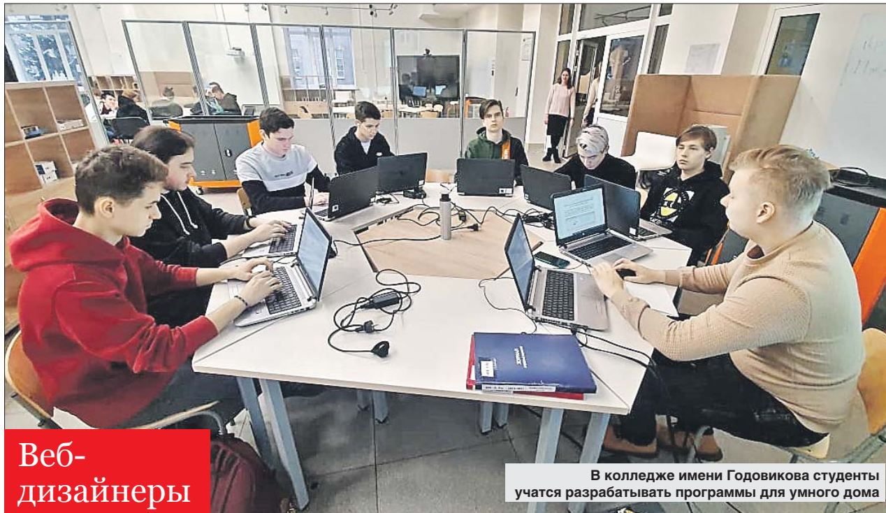
В колледже имени Годовикова студенты учатся разрабатывать программы для умного дома

Где в САО можно выучиться на программиста, аналитика и веб-дизайнера