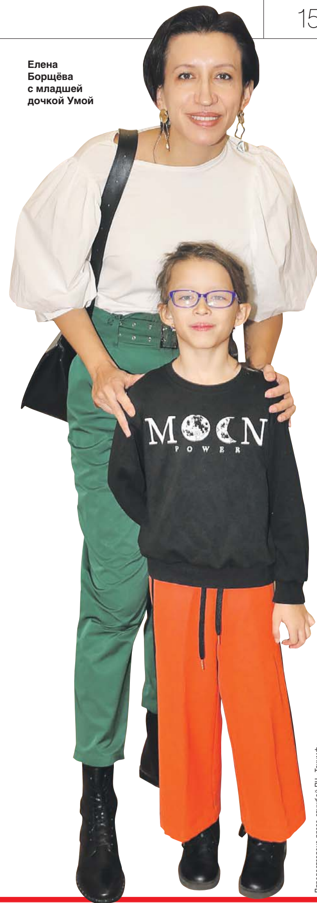
Предоставлено пресс-службой ПЦ «Триумф»