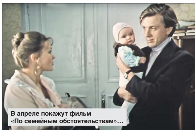
В апреле покажут фильм «По семейным обстоятельствам»...

У Ангарских прудов работает бесплатный кинотеатр под открытым небом