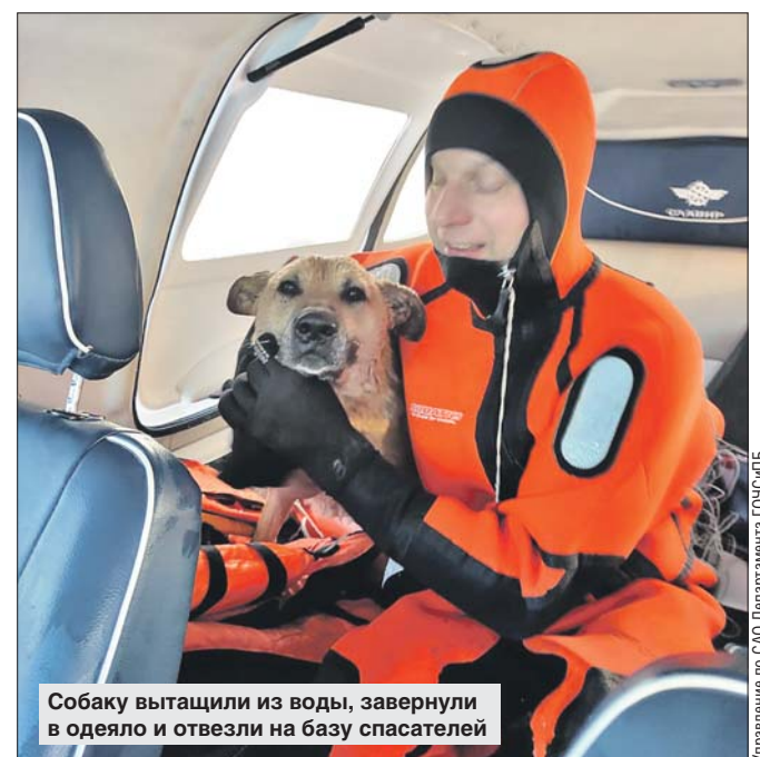
Собаку вытащили из воды, завернули в одеяло и отвезли на базу спасателей