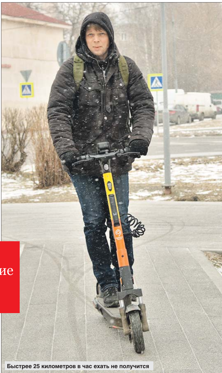
Быстрее 25 километров в час ехать не получится

Во сколько обойдётся поездка на электросамокате уличных пунктов проката