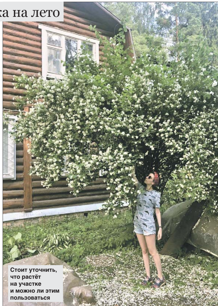
Стоит уточнить, что растёт на участке и можно ли этим пользоваться

— Было такое, что хозяева без предупреждения оставили людям своего кота. Клиенты его полюбили и кормили. Но бывает, что у кого-то, например, аллергия на шерсть и отдых превращается в испытание, — рассказал риелтор.