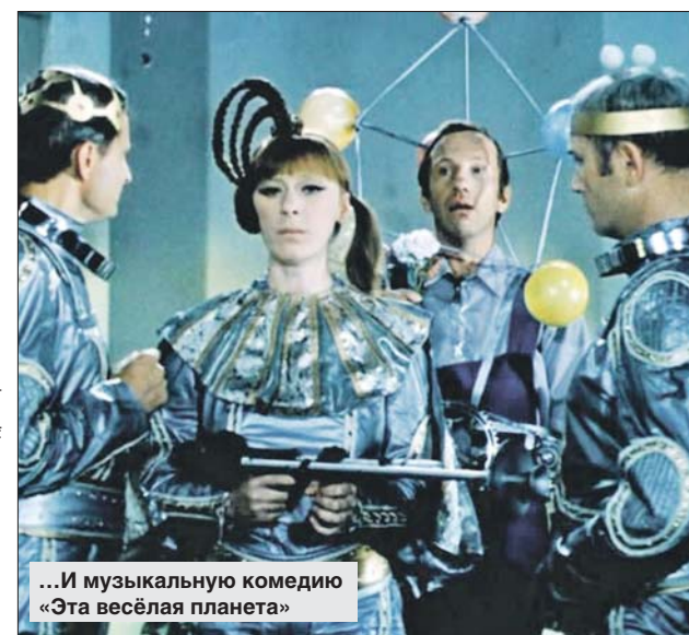
...И музыкальную комедию «Эта весёлая планета»

Летний кинотеатр в парке — это открытый амфитеатр на 300 мест и сцена со светодиодным экраном под огромным козырьком. Как завери-