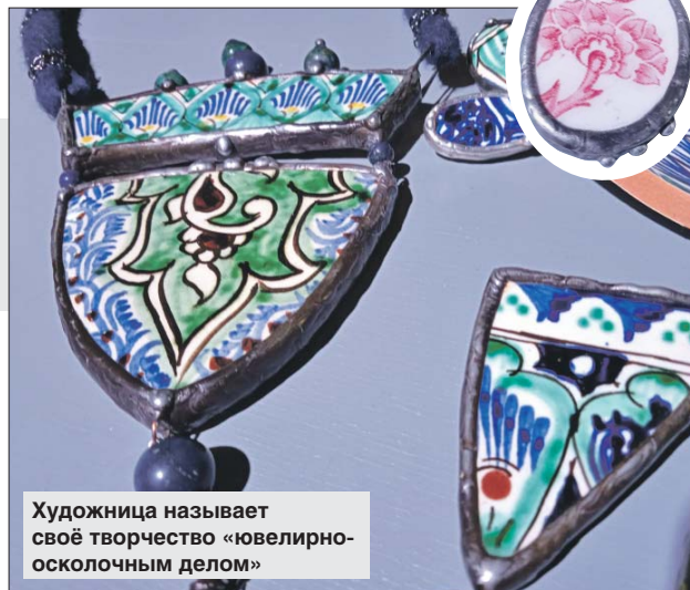
Художница называет своё творчество «ювелирно-осколочным делом»

Тата стала активно посещать различные ярмарки-развалы, а затем уже друзья, знакомые и соседи втянулись: стали приносить ненужную посуду. Да и трое детей в этом деле хорошие помощники: новые сервизы в семье долго не задерживаются. Особенно воспоминания у ху-