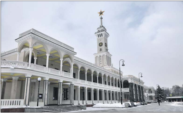
Туристический инфоцентр расположен на 1-м этаже исторического здания