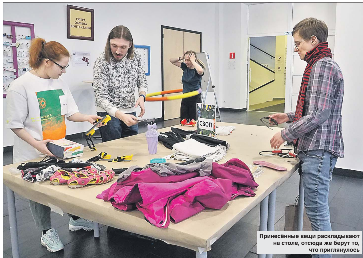
Принесённые вещи раскладывают на столе, откуда же берут то, что приглянулось