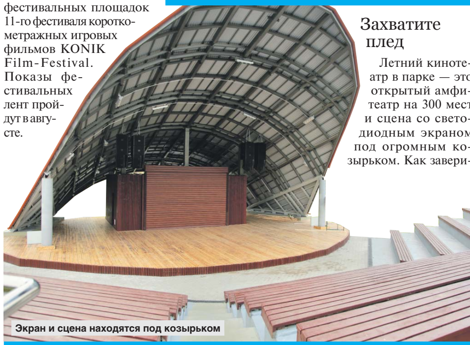
Экран и сцена находятся под козырьком

Кроме того, в этом году кинотеатр парка «Ангарские пруды» официально включён в перечень фестивальных площадок 11-го фестиваля короткометражных игровых фильмов KONIK Film-Festival. Показы фестивальных лент пройдут в августе.