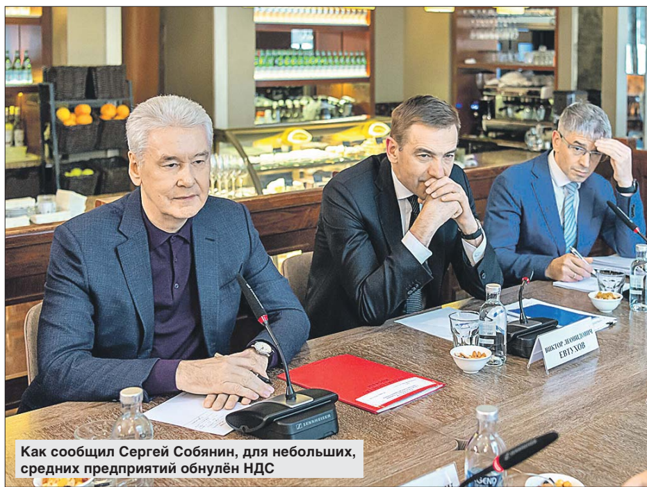
Как сообщил Сергей Собянин, для небольших, средних предприятий обнулён НДС

Кафе смогут воспользоваться льготными кредитами