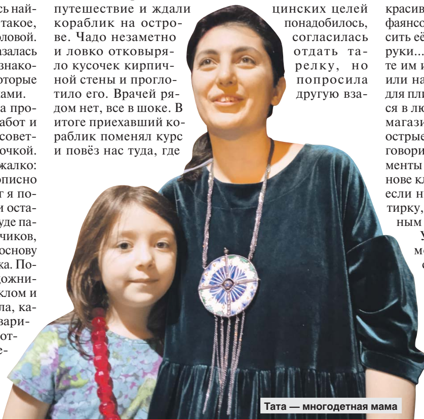
Тата — многодетная мама

принесли еду в... тарелке с пальмами. «Продайте!» — молю я. Повариха испугалась: вероятно, подумала, что мне для медицинских целей понадобилось, согласилась отдать тарелку, но попросила другую вза-