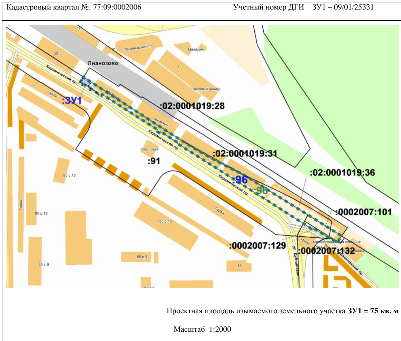
Схема расположения земельного участка на кадастровом плане территории: местоположение установлено относительно ориентира, расположенного в границах участка. Почтовый адрес ориентира: г Москва, ул. Дубнинская, вл. 52

к распоряжению Департамента городского имущества города Москвы от 17 февраля 2022 г. № 8251