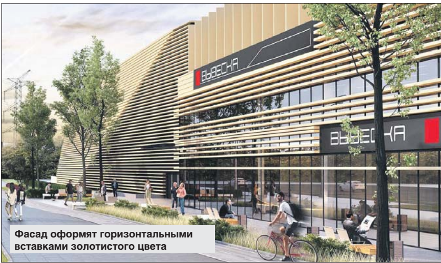
Фасад оформят горизонтальными вставками золотистого цвета