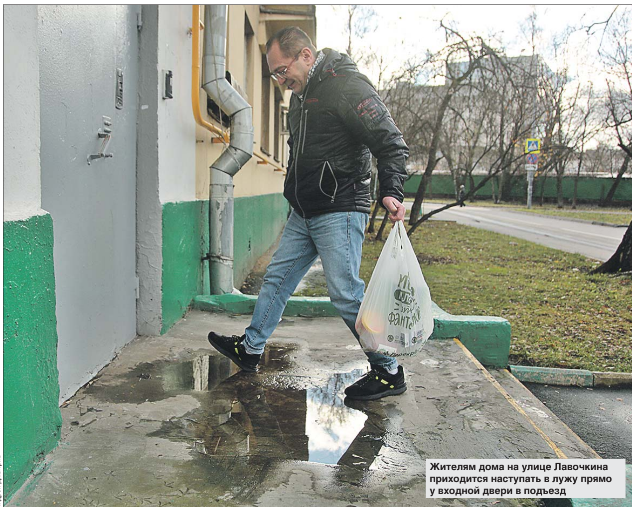
Жителям дома на улице Лавочкина приходится наступать в лужу прямо у входной двери в подъезд

По его словам, если лужа больше 4 кв. метров