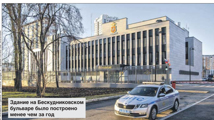
Здание на Бескудниковском бульваре было построено менее чем за год