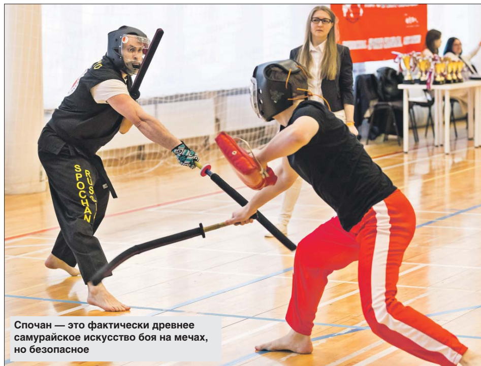
Спochан — это фактически древнее самурайское искусство боя на мечах, но безопасное

Боец осваивает всё оружие, которым обязан был владеть самурай