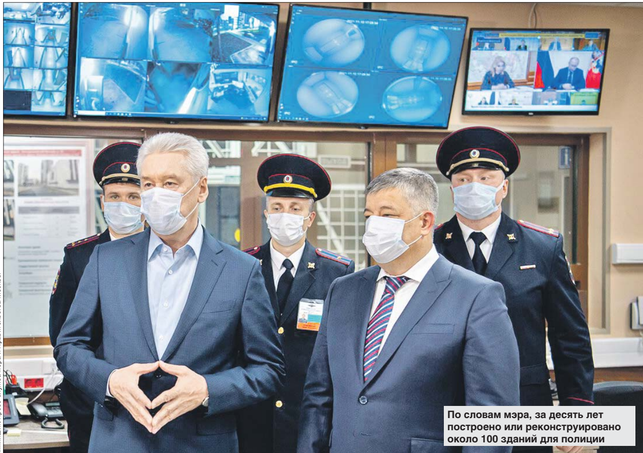
По словам мэра, за десять лет построено или реконструировано около 100 зданий для полиции

Теперь у сотрудников отдела есть тир и актовый зал