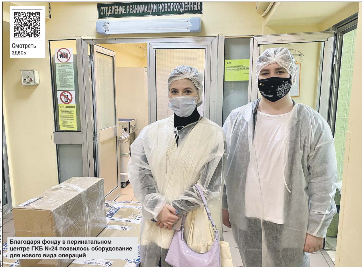
Благодаря фонду в перинатальном центре ГKB №24 появилось оборудование для нового вида операций

Недавно фонд «Страна — детям» начал поддерживать не только семьи, но и крупные медицинские учреждения. Благодаря средствам, собранным фондом, было заку-