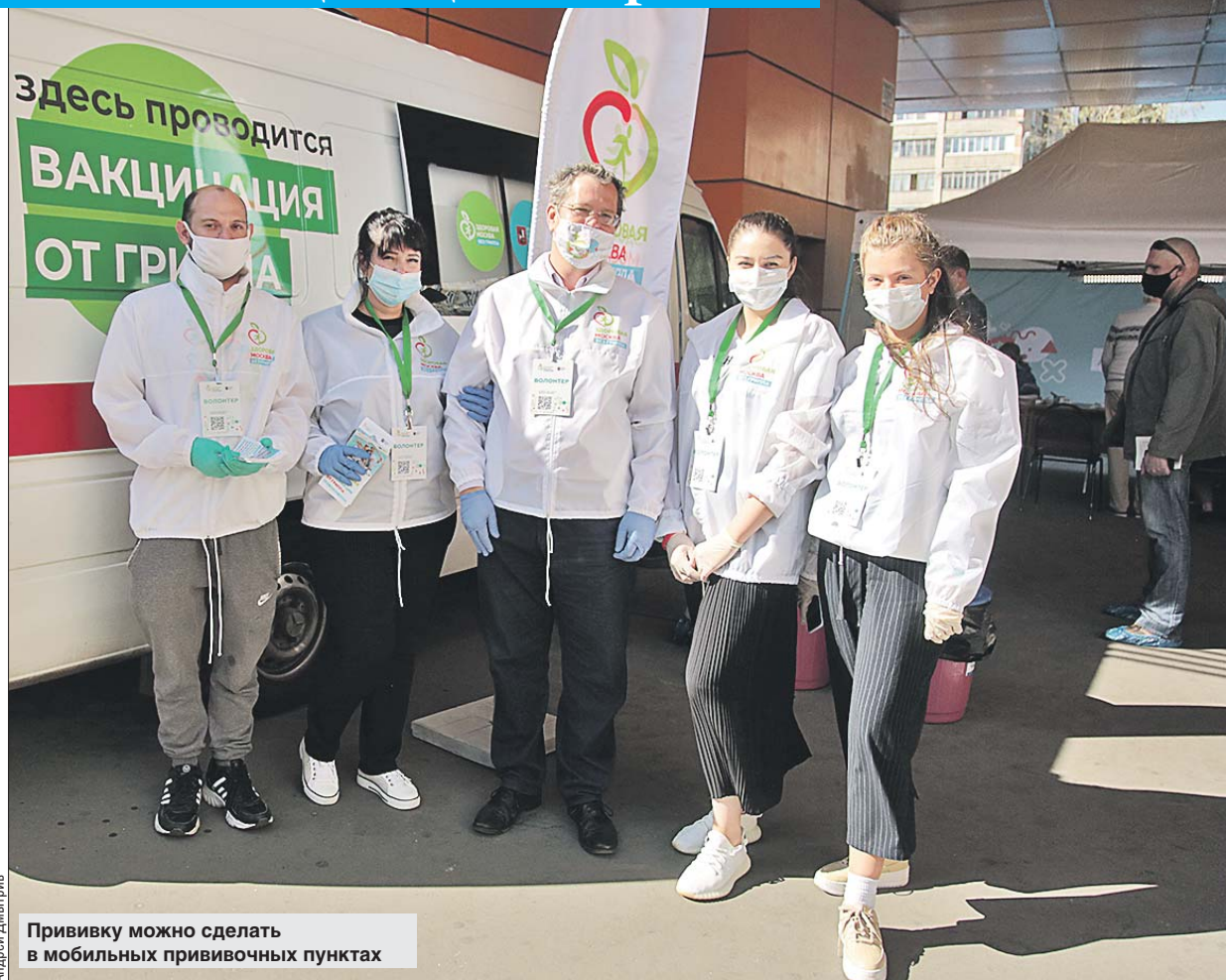
Прививку можно сделать в мобильных прививочных пунктах

Как подчеркнул глава Депздрава, в случае с гриппом вакцинация — единственная надёжная защита организма.