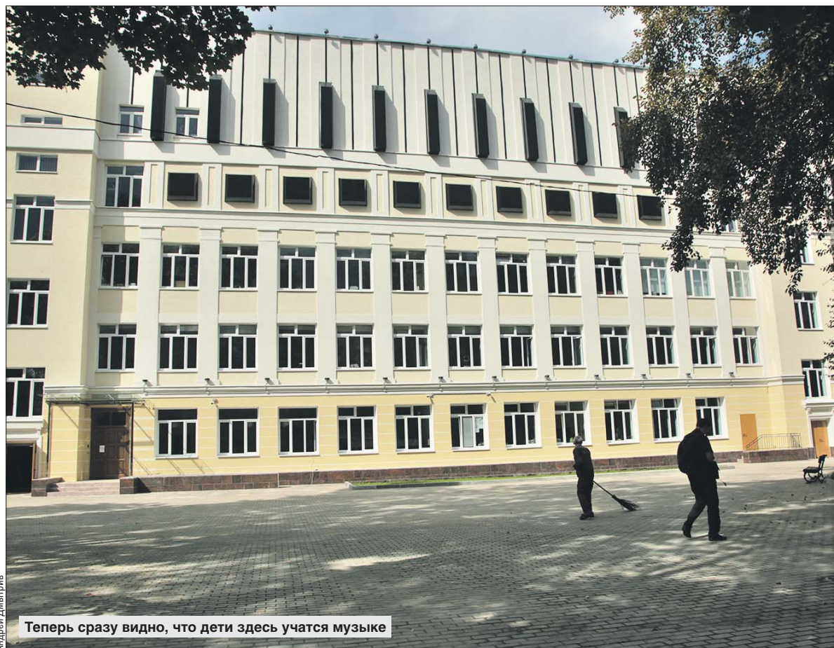
Теперь сразу видно, что дети здесь учатся музыке