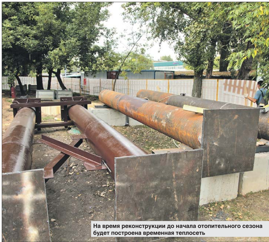
На время реконструкции до начала отопительного сезона будет построена временная теплосеть

— На Онежской началась перекладка тепловой сети для подключения к системам теплоснабже-