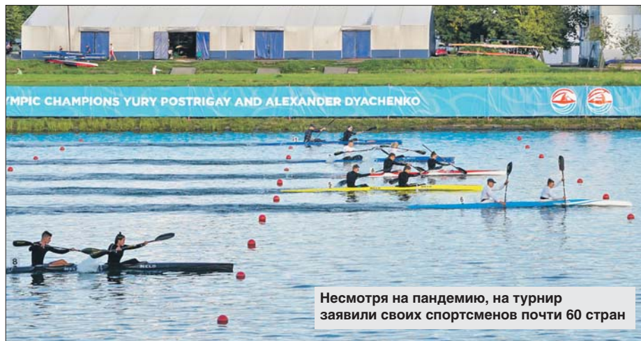
Несмотря на пандемию, на турнир заявили своих спортсменов почти 60 стран