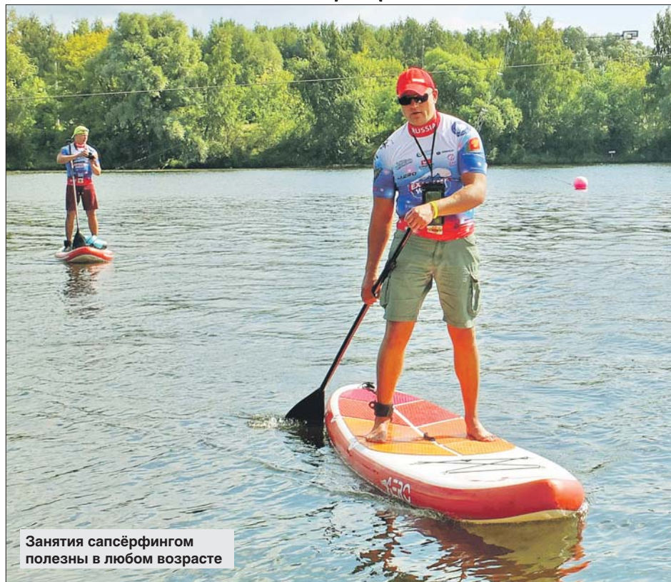
Занятия сапсёрфингом полезны в любом возрасте

Это универсальный вид спорта и отдыха. Круизные SUP-доски годятся для новичков. Туринговые — профессиональные узкие доски, они менее устойчивы, зато развивают хорошую скорость. Big-SUP — это целый плот для корпоративных гонок или для прогулок большой компа-