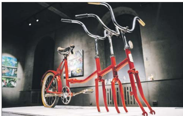
В экспозиции представлены фотографии, видеоролики, инсталляции и арт-объекты