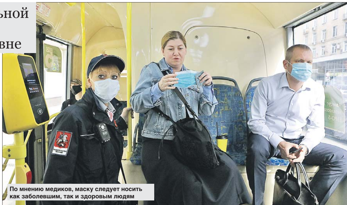
По мнению медиков, маску следует носить как заболевшим, так и здоровым людям

Также важно при чихании закрывать рот и нос салфеткой или локтем, причём салфетку следует тут выбросить. А при первых признаках простуды соблюдать самоизоляцию и сразу обратиться за медицинской помощью.