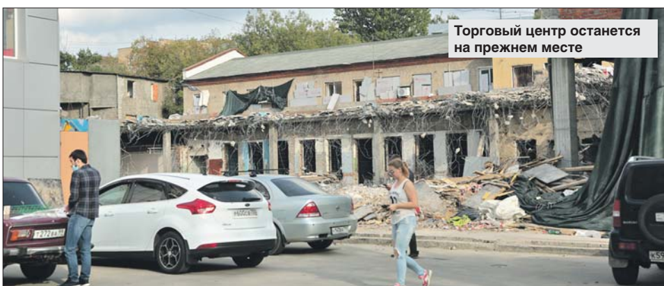
Торговый центр останется на прежнем месте

Управа района Аэропорт: ул. Усевича, 23/5, тел. (499) 151-3656. Эл. почта: sa0-aeroport@mos.ru