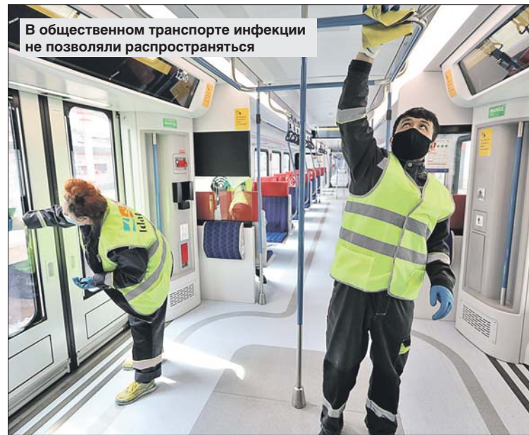
В общественном транспорте инфекции не позволяли распространяться

Мы не допустили коллапса здравоохранения, смогли защитить старшее поколение