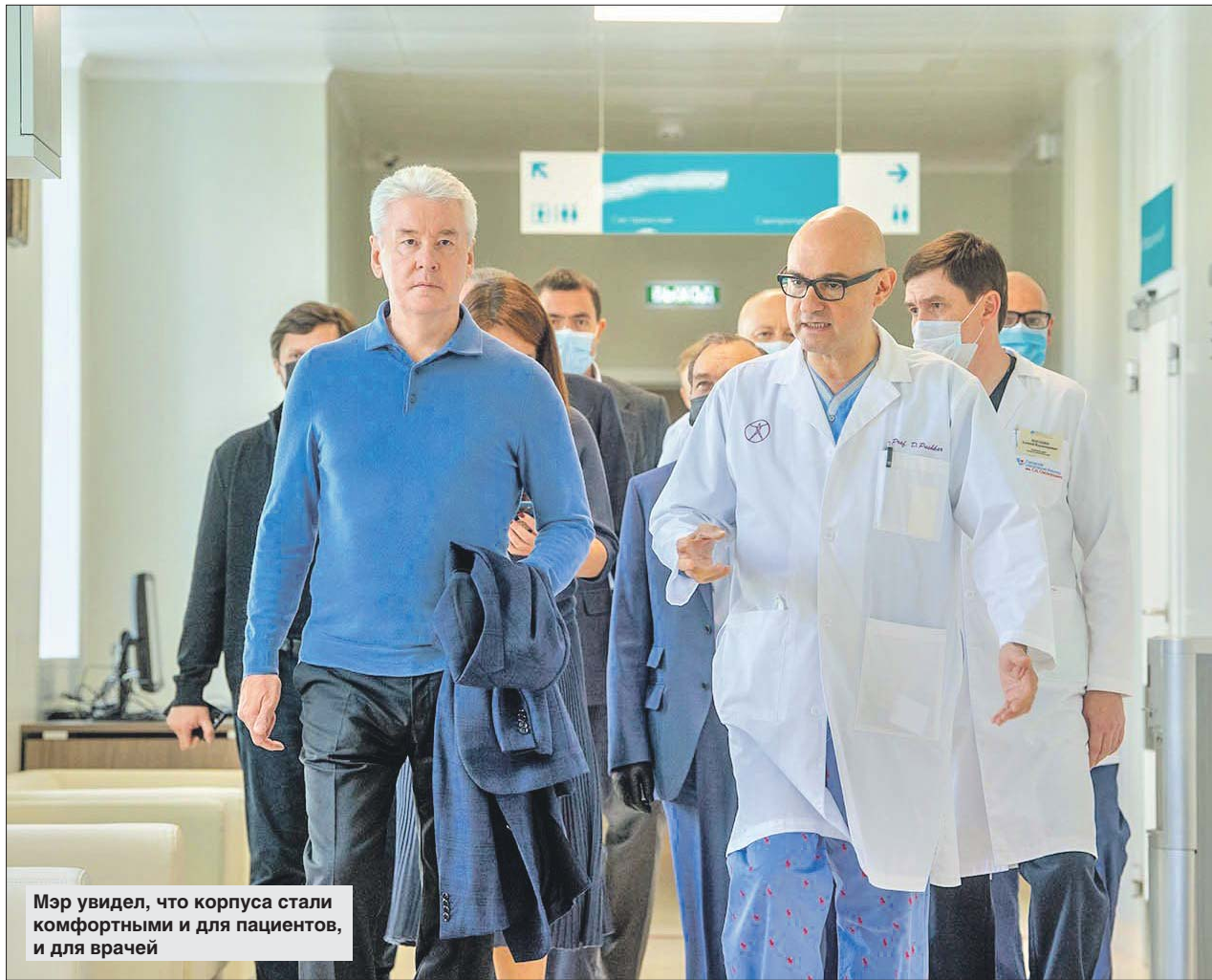
Мэр увидел, что корпуса стали комфортными и для пациентов, и для врачей

Сергей Собянин напомнил, что во время пандемии три корпуса этой больницы вели приём и лечили москвичей, заболевших коронавирусом.