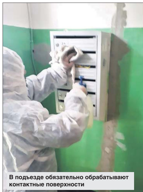
В подъезде обязательно обрабатывают контактные поверхности

Управа района Коптево: ул. 3-я и А. Космодемьянских, 31, корп. 1, тел. (495) 450-4889. Эл. почта: sa0-koptevo@mos.ru. Единая диспетчерская ЖКХ г. Москвы: (495) 539-5353