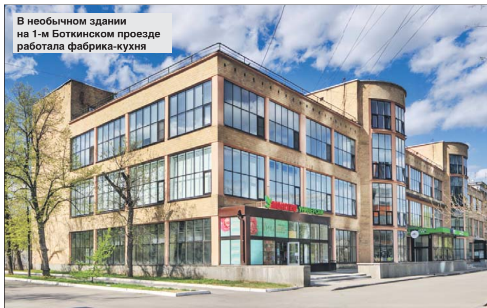
В необычном здании на 1-м Боткинском проезде работала фабрика-кухня