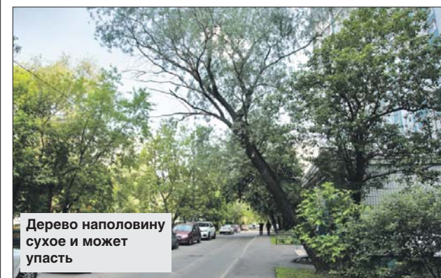
Дерево наполовину сухое и может упасть

Управа района Западного Дегунино: Дегунинская ул., 1, корп. 1, тел. (499) 487-7036. Эл. почта: saowdeg@mos.ru