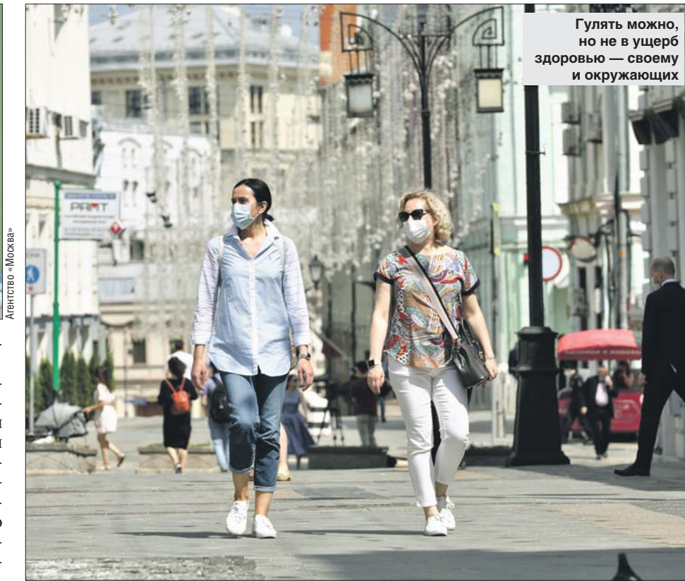
Гулять можно, но не в ущерб здоровью — своему и окружающих

Эксперты Всемирной организации здравоохранения (ВОЗ) считают, что в условиях пандемии коронавируса людям необходимо использовать маски для защиты от заражения. Об этом журналистам рассказал генеральный директор ВОЗ Тедрос Аданом Гебрейесус.