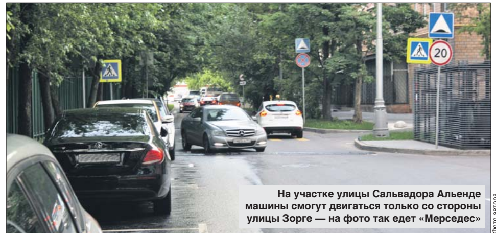
На участке улицы Сальвадора Альенде машины смогут двигаться только со стороны улицы Зорге — на фото так едет «Мерседес»