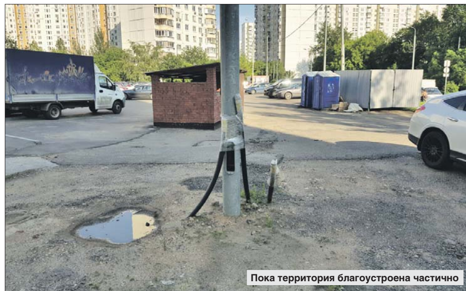
Пока территория благоустроена частично

Осенью рядом высадят деревья и кустарники