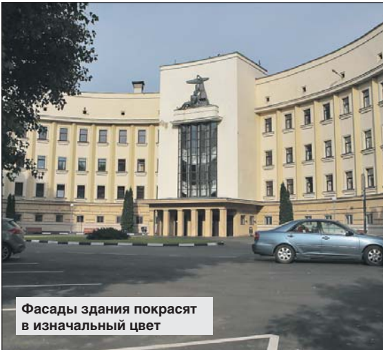
Фасады здания покрасят в изначальный цвет