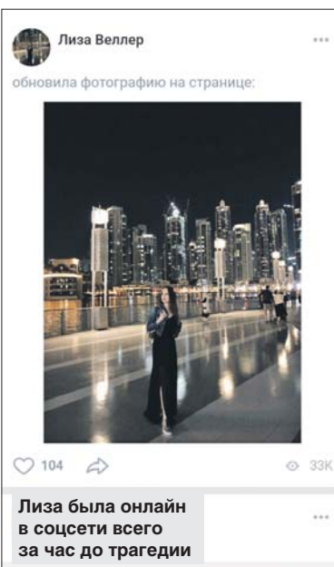
Лиза была онлайн в соцсети всего за час до трагедии

— Ещё вчера мама Лизы гуляла здесь с внуком, — говорят женщины на детской площадке. — Мы часто их видели, с ребёнком гуляла в основном она. Семья была дружная, спокойная.