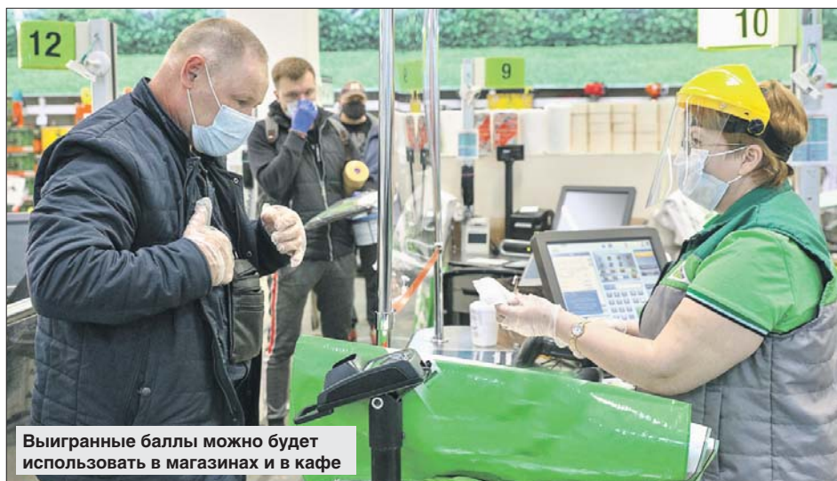
Выигранные баллы можно будет использовать в магазинах и в кафе