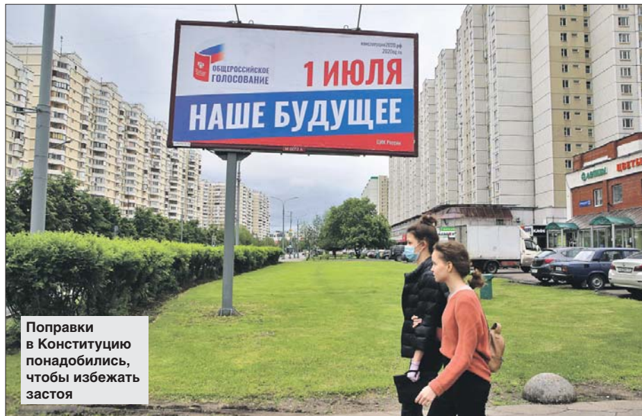
Поправки в Конституцию понадобились, чтобы избежать застоя

Но настал момент, когда довольствоваться стабильностью нельзя. Стране необходимо двигаться дальше, исполь-