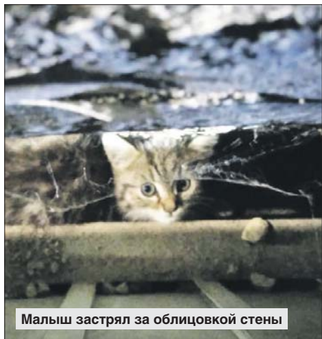
Малыш застрял за облицовкой стены