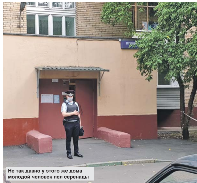
Не так давно у этого же дома молодой человек пел серенады