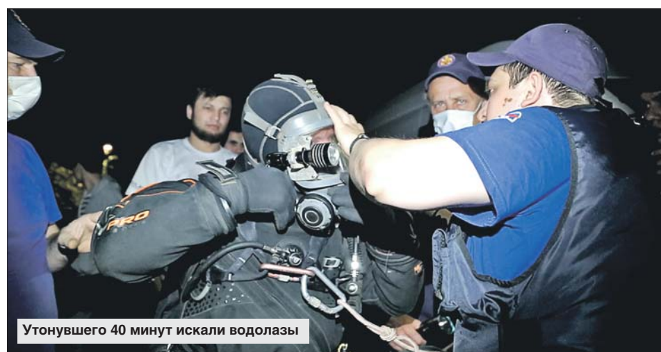
Утонувшего 40 минут искали водолазы