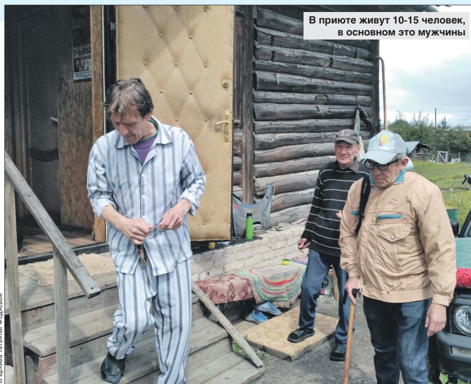
В приюте живут 10-15 человек, в основном это мужчины

Татьяна говорит, что жители приюта многим обеспечивают себя сами: