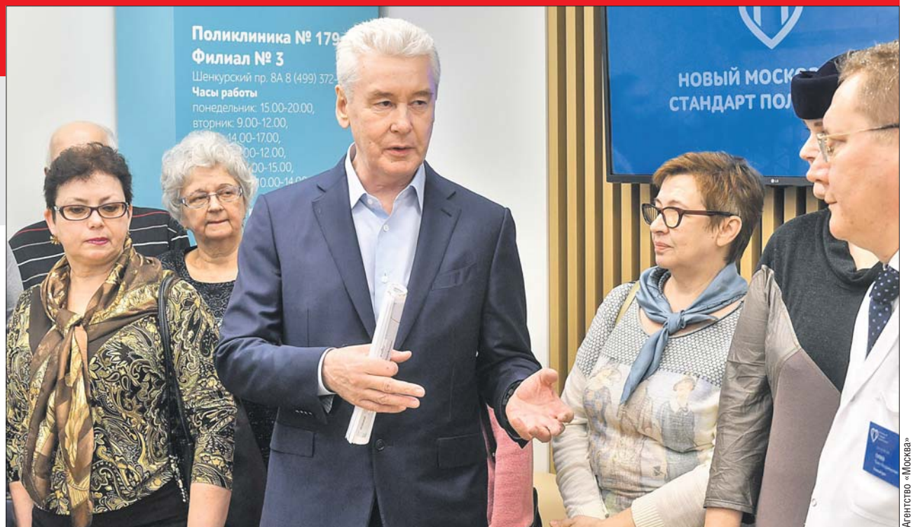
Сергей Собянин рассказал о планах дальнейшей модернизации городских поликлиник

Несколько лет назад началась модернизация столичного здравоохранения. По словам Сергея Собянина, для больниц стали покупать новое высокотехнологичное обо-