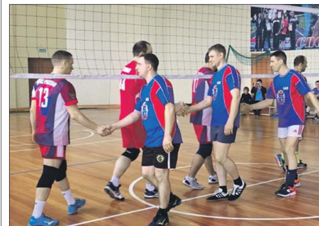
С 9-го места в прошлом году сборная САО поднялась на 1-е