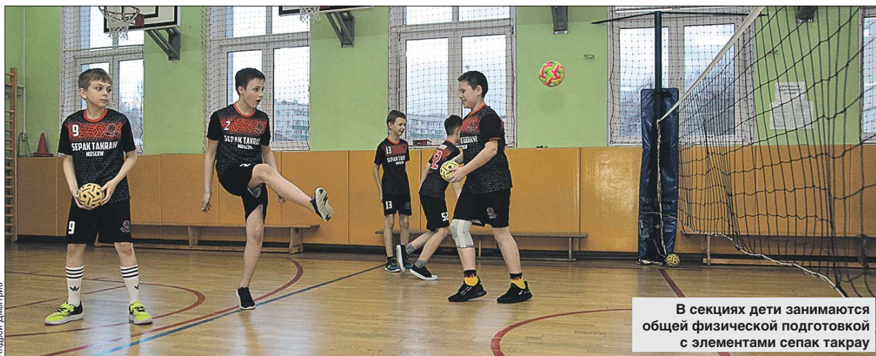
В секциях дети занимаются общей физической подготовкой с элементами сепак такрау