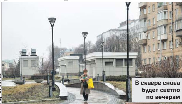
В сквере снова будет светло по вечерам

— В настоящее время АО «Мосинжпроект» проводит ремонт опор освещения в сквере на Балтийской улице. Работы планируется завершить до