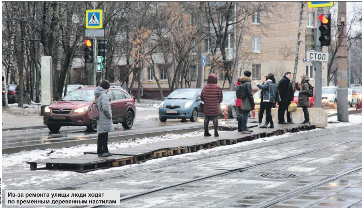
Из-за ремонта улицы люди ходят по временным деревянным настилам

— На этой улице ведутся работы по благоустройству в рамках создания транспортно-пересадочного узла «Стрешнево» — интеграции МЦК и радиального направления Московской железной дороги. Управа района Сокол направила заказчику работ — ГКУ «Дирекция капитального ремонта Департамента капитального ремонта города Москвы» — ДКР — обращение с просьбой привести территорию в надлежащее состояние и предоставить информацию о сроках устранения дефектов, которые были выявлены после выполнения работ, — сообщил