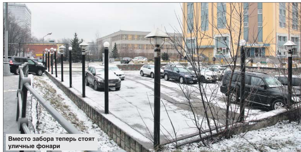
Вместо забора теперь стоят уличные фонари