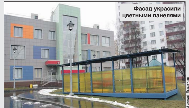
Фасад украсили цветными панелями