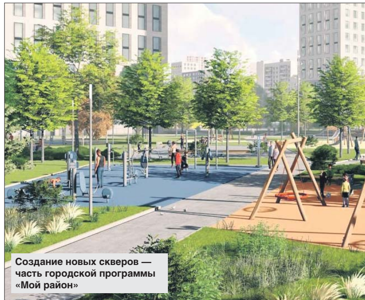
Создание новых скверов — часть городской программы «Мой район»