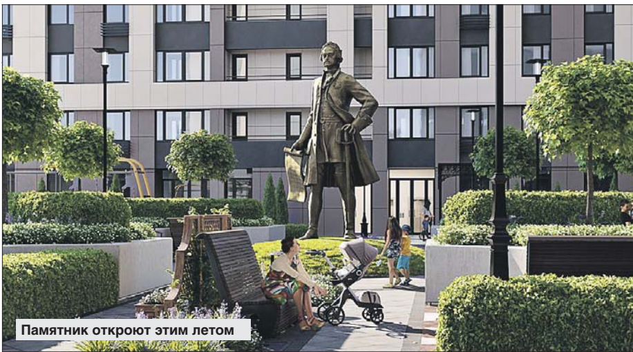
Памятник откроют этим летом