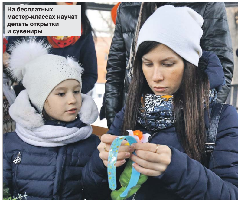
На бесплатных мастер-классах научат делать открытки и сувениры

театральной студии «Премьера» покажут отрывок из произведения Ксении Драгунской «От души и на память».