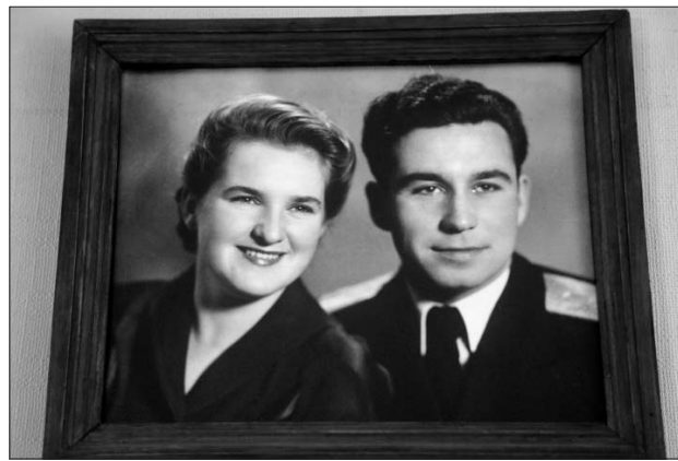
Они поженились в 1954-м