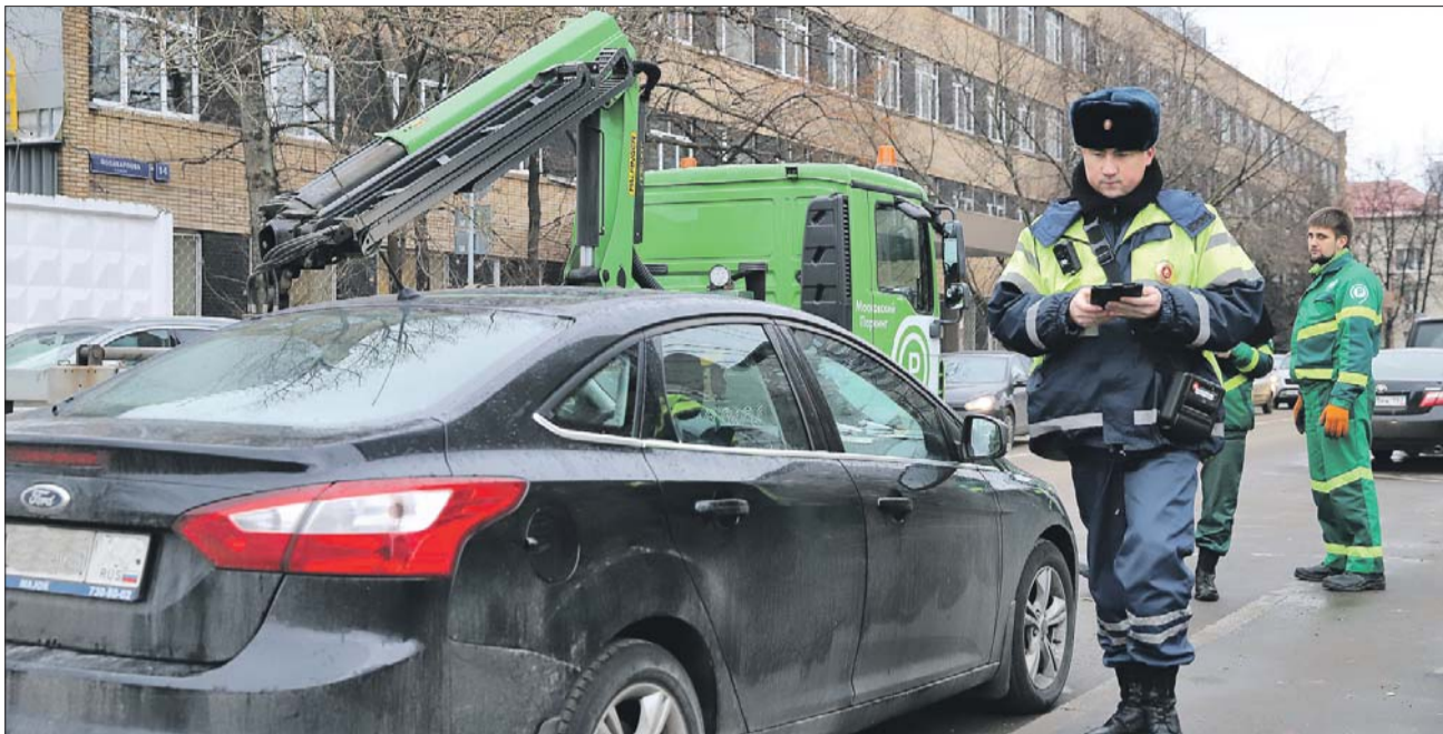
Нарушители правил парковки найдут свою машину на штрафстоянке

Нарушителя долго искать не приходится: у дома 17 на улице Поликарпова неправильно припаркован «Форд». Знак, запрещающий стоянку, тут поставлен не случайно: дорога узкая, из-за припар-