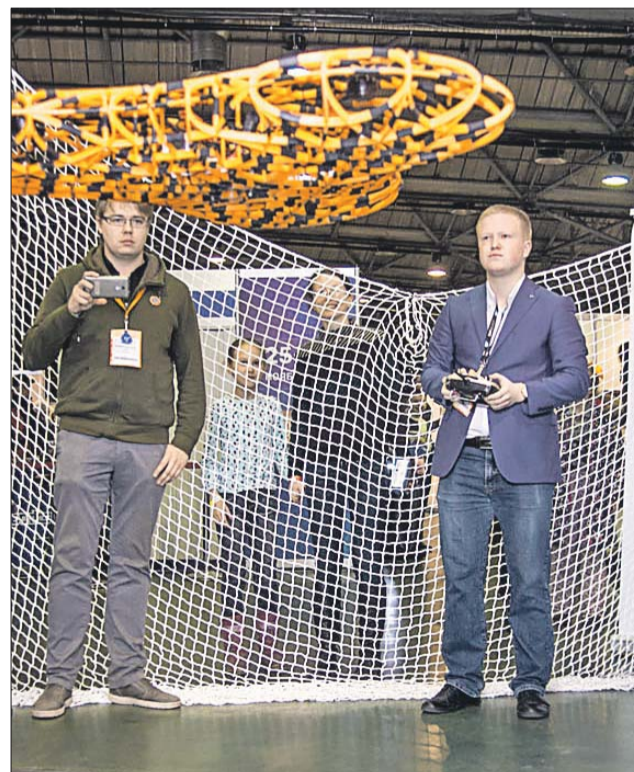
Гексакоптер на недавно прошедшей выставке в «Сокольниках» Robotics Expo-2017