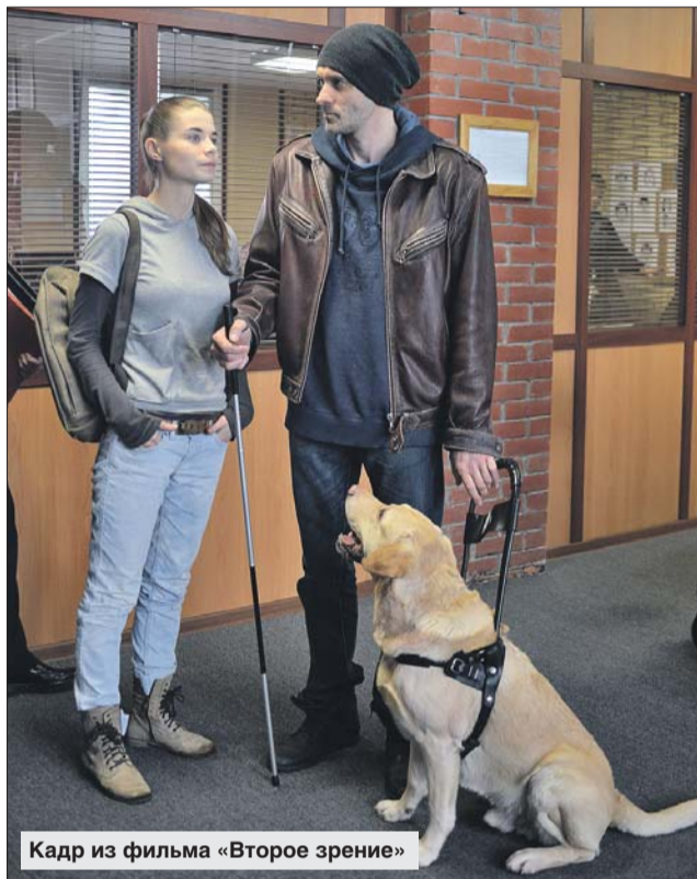
Кадр из фильма «Второе зрение»

— С самого начала карьеры у меня всегда было достаточно много съёмки. И глобальных перерывов между проектами не было