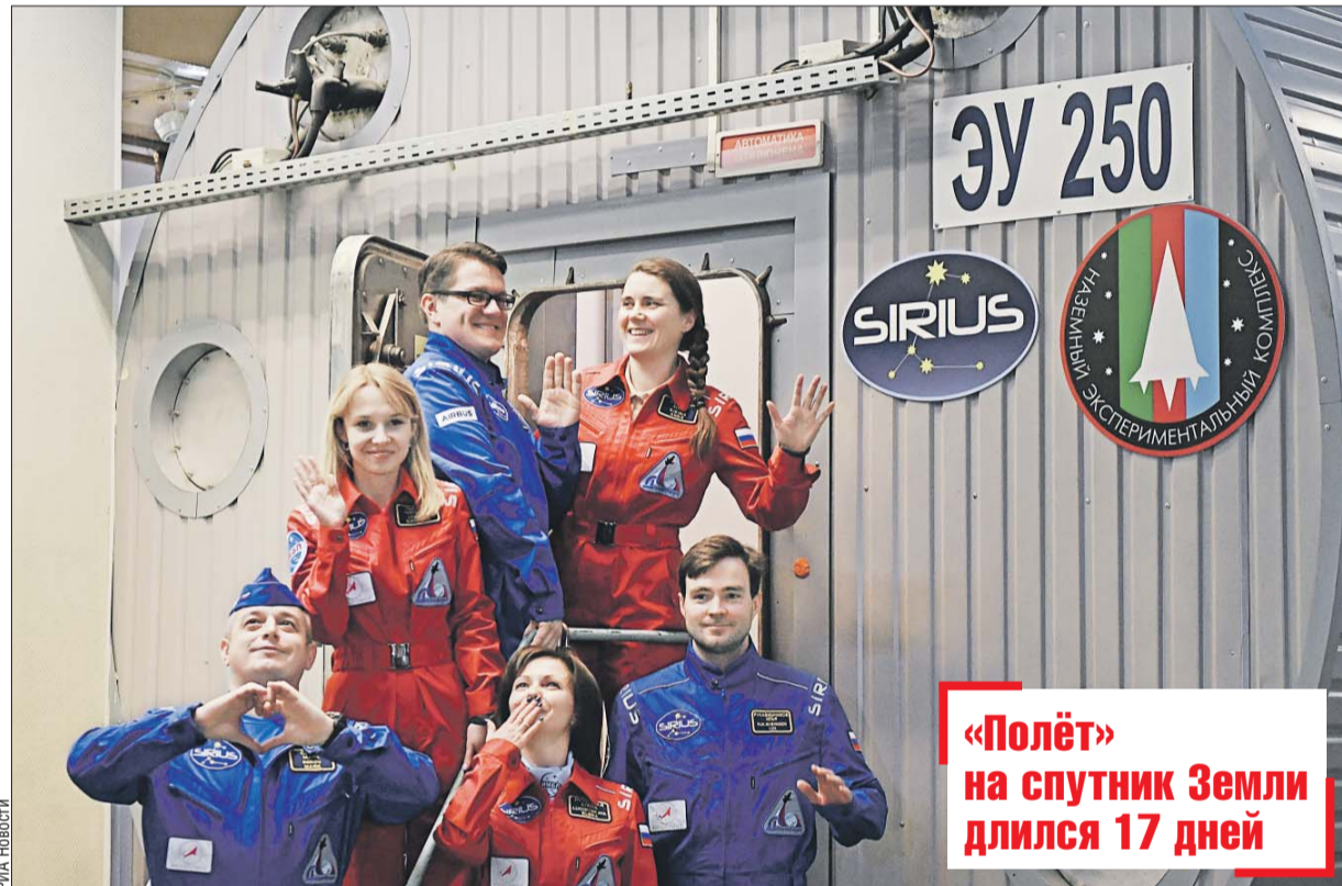
«Полёт» на спутник Земли длился 17 дней

Экипаж наземного «космического корабля» 17-дневного эксперимента SIRIUS по имитации полёта к Луне «вернулся» на Землю и открыл люки, сообщил корреспондент РИА «Новости» из Института медико-биологических проблем (ИМБП), который располагается в CAO.