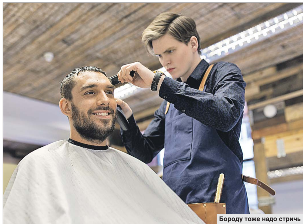
Бороду тоже надо стричь

Брадобрей и цирюльник из САО ответили на вопросы о мужских стрижках