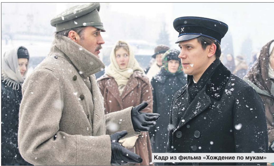
Кадр из фильма «Хождение по мукам»

— Меняется не только взгляд: банально можно забыть слова и сорвать сцену. Я на съёмках алкоголь не употребляю никогда. Правда, помню, в одном из фильмов мы снимали последнюю сцену, где по сценарию мы с героиней должны были сидеть и общаться по душам. И ре-