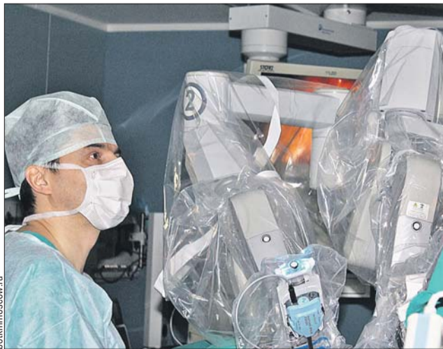
Робот может выполнять гинекологические операции

По его словам, обе операции были гистерэктомиями (удалением матки). Во втором случае положение осложнилось раком