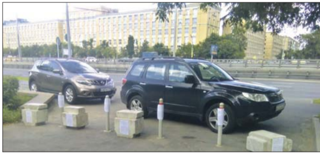
Проезд во двор преграждали столбики и плиты

родского имущества межквартирного квартала (распоряжение от 18 февраля 2016 года №2967), куда входит и дом 59 на Ленинградском проспекте, оказалось, что четыре противопожарных столбика, перекрывающих проезд со стороны Ленинградского