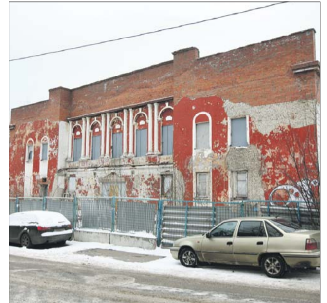
Здание кинотеатра выставлено на торги

В управе Дмитровского района сообщили, что здание дома культуры «Восход» находится в ведении Департамента городского имущества г. Москвы.