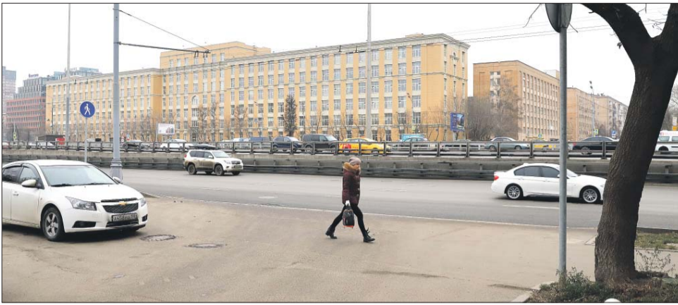
Теперь проезд свободен, но это не решило проблему