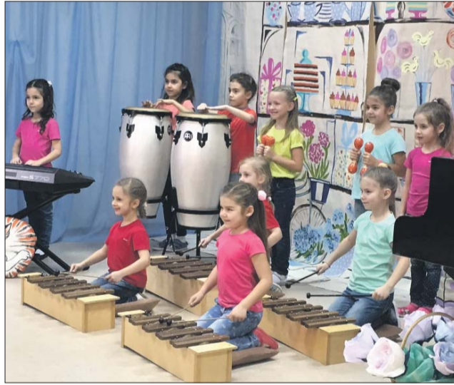
На занятиях по орф-педагогике

Адрес: ул. Новопетровская, 1а. Сайт www.orff.ru