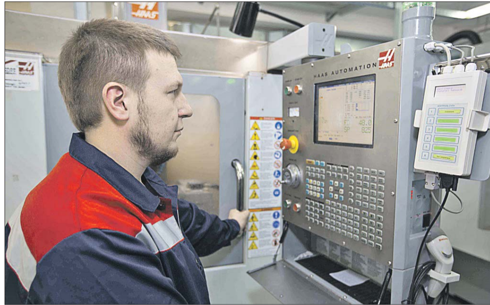
В НПО «Наука» — самое современное оборудование

— Не надо дожидаться, когда подойдёт период подтверждения статусов технопарков и промышленных комплексов, чтобы потом обнулили эти статусы.