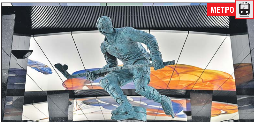
На станции — хоккеист в форме 1950-х годов