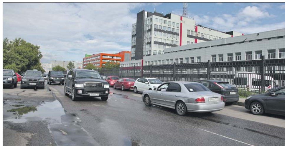
С 30 июня Дубнинский проезд станет односторонним