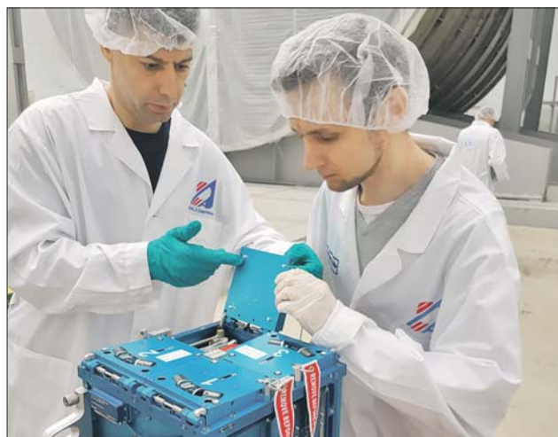
Сборка студенческого спутника