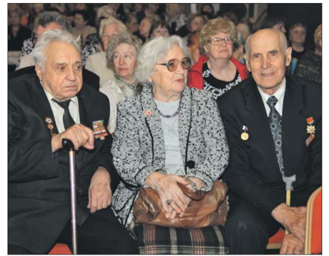
Ветераны округа почтили память погибших в войне