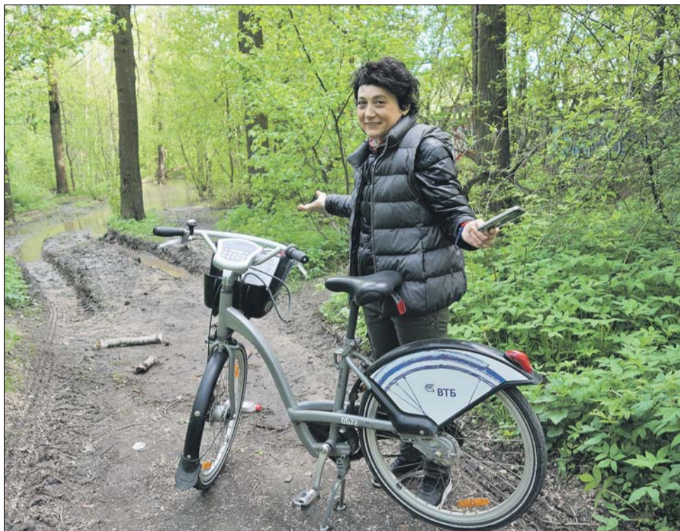
За велопогулку по Тимирязевскому парку пришлось заплатить

Весь маршрут от дома до работы — порядка