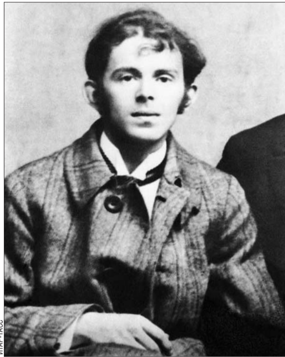
Осип Мандельштам, фото 1914 года