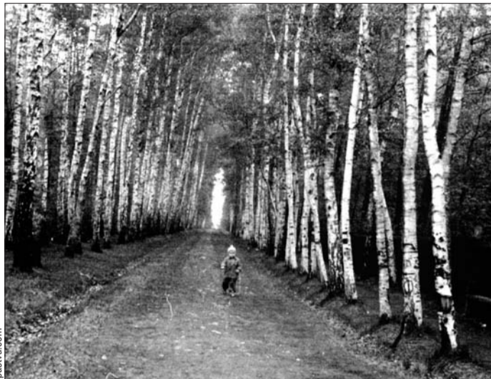
Со времён Мандельштама берёзовая аллея не изменилась

О том, как выглядел её новый дом, Лиля рассказала в воспоминаниях: «Мы приехали на окраину Москвы. Слева — высокая железнодорожная насыпь. Мы вышли на Новое шоссе, повернули вправо: мрачный пролёт железнодорожного моста, зелёный огонёк семафора и в небе два корявых обнажённых дерева. Шоссе уходило вдаль, в темноту, в стороне стоял двухэтажный деревянный дом. Неподалёку от дома начинались прекрасные тимирязевские леса с берёзовыми рощами, вокруг дома — большие огороды».