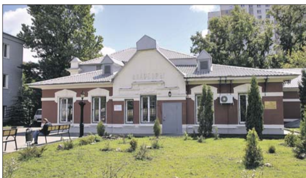
Старое здание станции «Лихоборы»

Более 30 зданий, которые украсят подсветкой, имеют статус объектов культурного наследия. В прошлом году они были отреставрированы. Всего архитектурно-художественную подсветку получат объекты 15 исторических станций вблизи платформ МЦК. Речь идёт о станциях «Андроновка», «Угрешская», «Кутузовская», «Лихоборы», «Владыкино», «Ростокино», «Белокаменная», «Лефор-