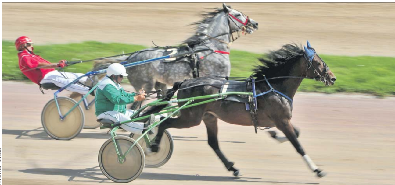
Угадать, кто победит, практически невозможно

— У меня есть своя, годами отработанная схема, но о ней я никому не расскажу. Она безотказно работает и на скачках, и на футболе, и на хоккее. Бла-