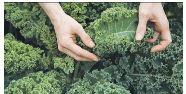
Капуста кале выдерживает первые осенние морозы