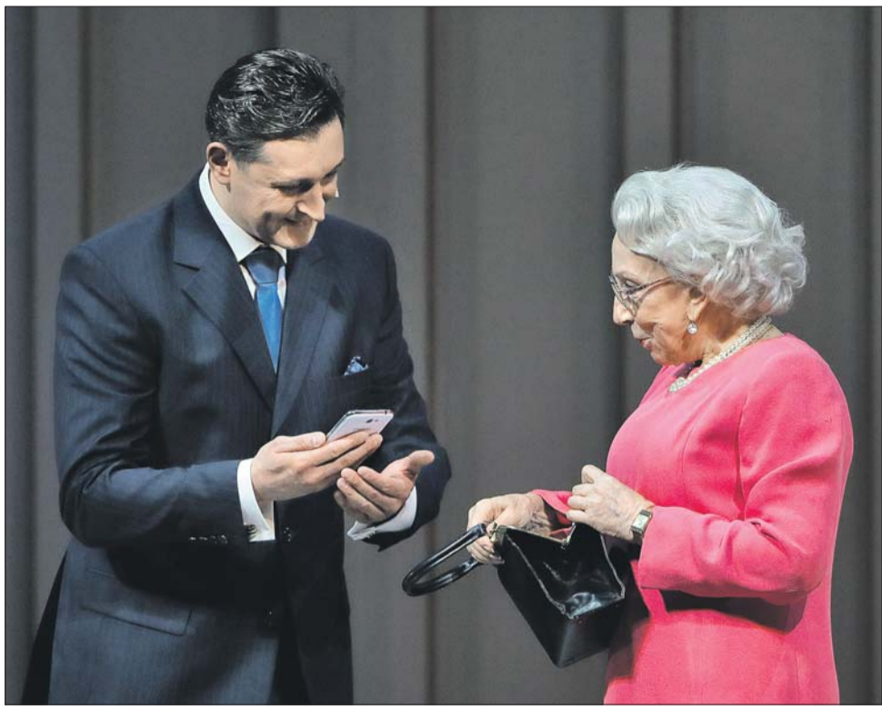
Сцена из спектакля «Аудитория»