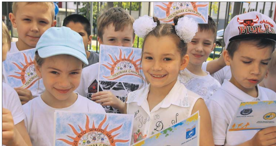
Дети округа интересно проводят свои каникулы

— Здесь больше занятий, чем в обычном лагере, и гораздо интереснее. Большой