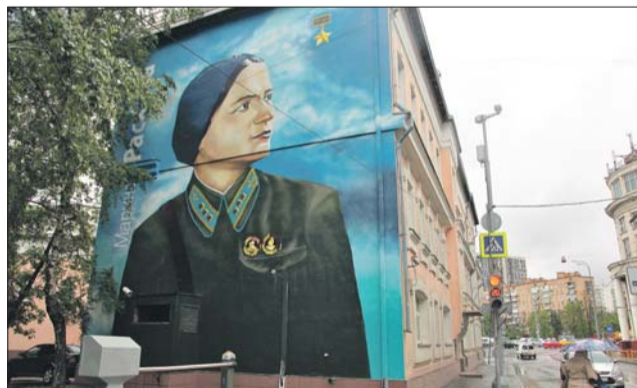
Граффити на Нижней Масловке

— Эскизы рисунков находятся пока на согласовании. Большинство объектов расположены рядом с детскими площадками, поэтому предлагаем рисунки из известных отече-