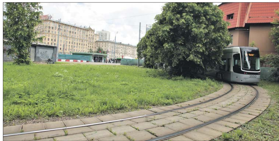
Лавочки рядом с трамвайным кругом ставить не будут