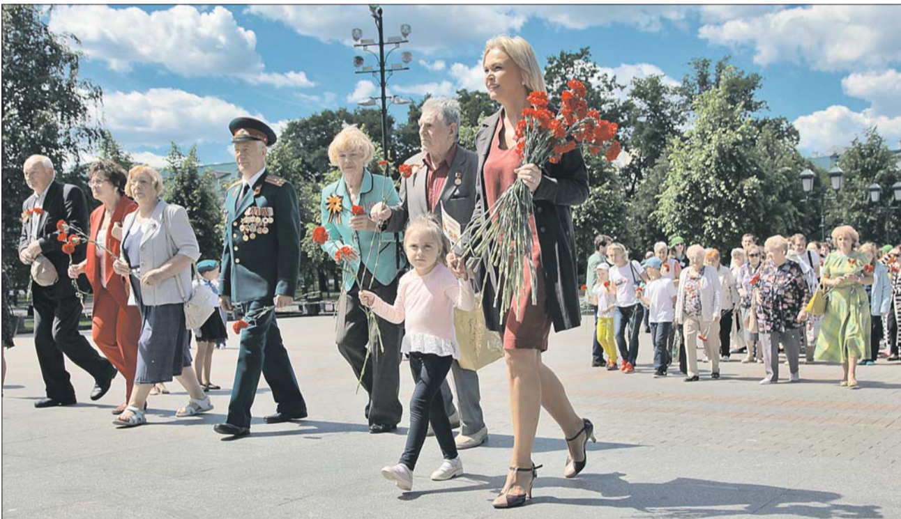
Депутат Ирина Белых возлагает цветы к Могиле Неизвестного Солдата