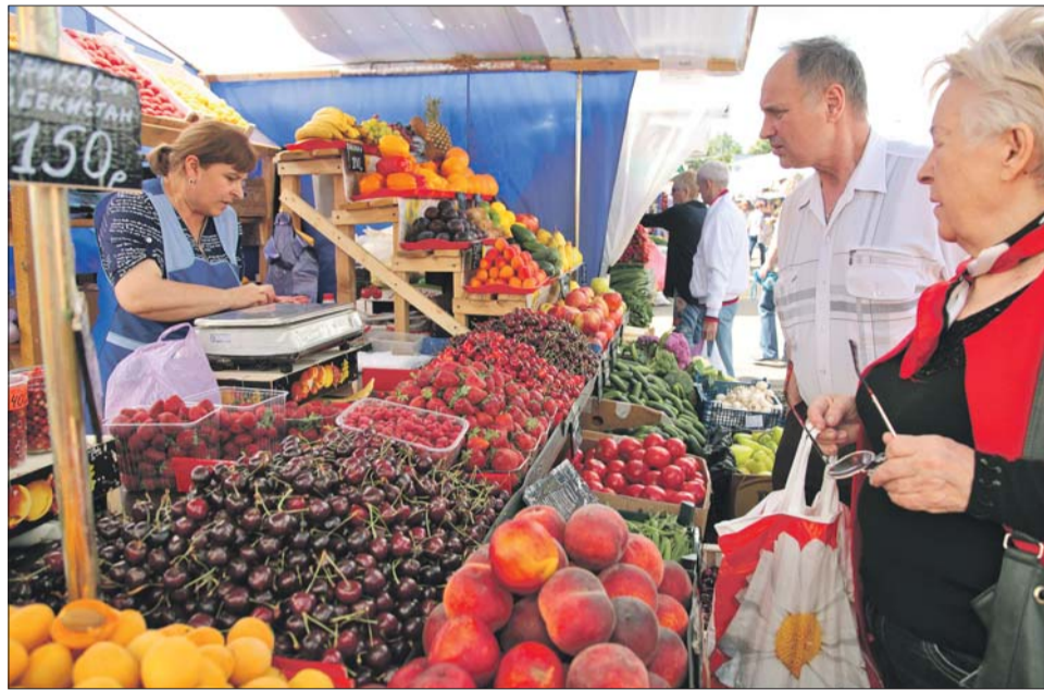
Коптевский рынок очень популярен у жителей САО

— Вопрос о закрытии рынка или о его сносе органами исполнительной власти не рассматривался. Внешний облик Коптевского рынка сформировался давно, и на сегодня его вид и внутреннее содержание уже не отвечают современным требованиям. Реализация продукции на розничных рынках должна осуществляться в капитальных зданиях, строениях и сооружениях. Владельцы рынка рассматривали возможность