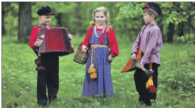
Дети выступают в народных костюмах