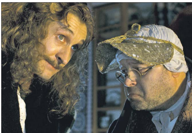
Кадр из фильма «Тайны дворцовых переворотов»

что это может стать моей профессией. Я хотел пройти путь моих предков: отец, дед и прадед служили. Я поступил в Омское танковое инженерное военное училище, приняв это решение ровно за три дня, чем ошарашил маму и чрезвычайно обрадовал папу. Тайно послал туда документы и только потом рассказал им, что меня взяли.