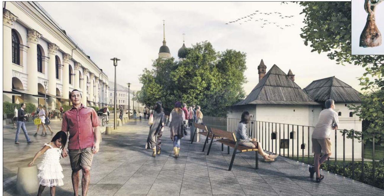
Такой будет улица Варварка

В Москве началась подготовка к благоустройству новой пешеходной зоны — от Кремля до парка «Зарядье». Она протянется через Рыбный и Богоявленский переулки и Биржевую площадь. Сейчас здесь заменяют трубы газопровода и водопровода, прокладывают кабельную канализацию, в которую уберут провода. Потом тротуары начнут мостить гранитными плитами, устанавливать бортового камень, лавочки и фонари с энергосберегающими лампами. Осенью пешеходную зону озеленят. Перекрывать движение транспорта на время бла-