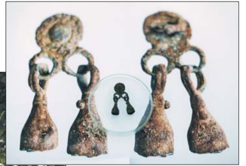
Височное украшение финно-угорской женщины, жившей в Москве в XII веке

Все работы «Моей улицы» сопровождает археологический мониторинг. Его осуществляют более 100 специалистов, которые выезжают на строительные площадки.