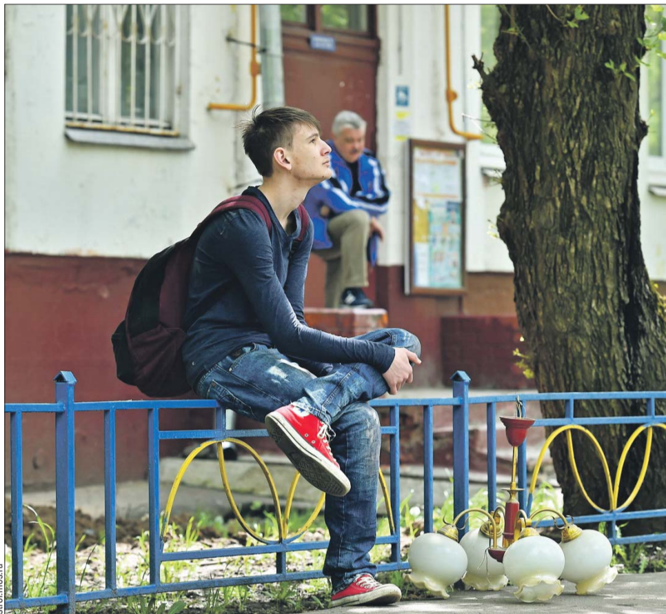
Москвичи определили судьбу своих пятиэтажек