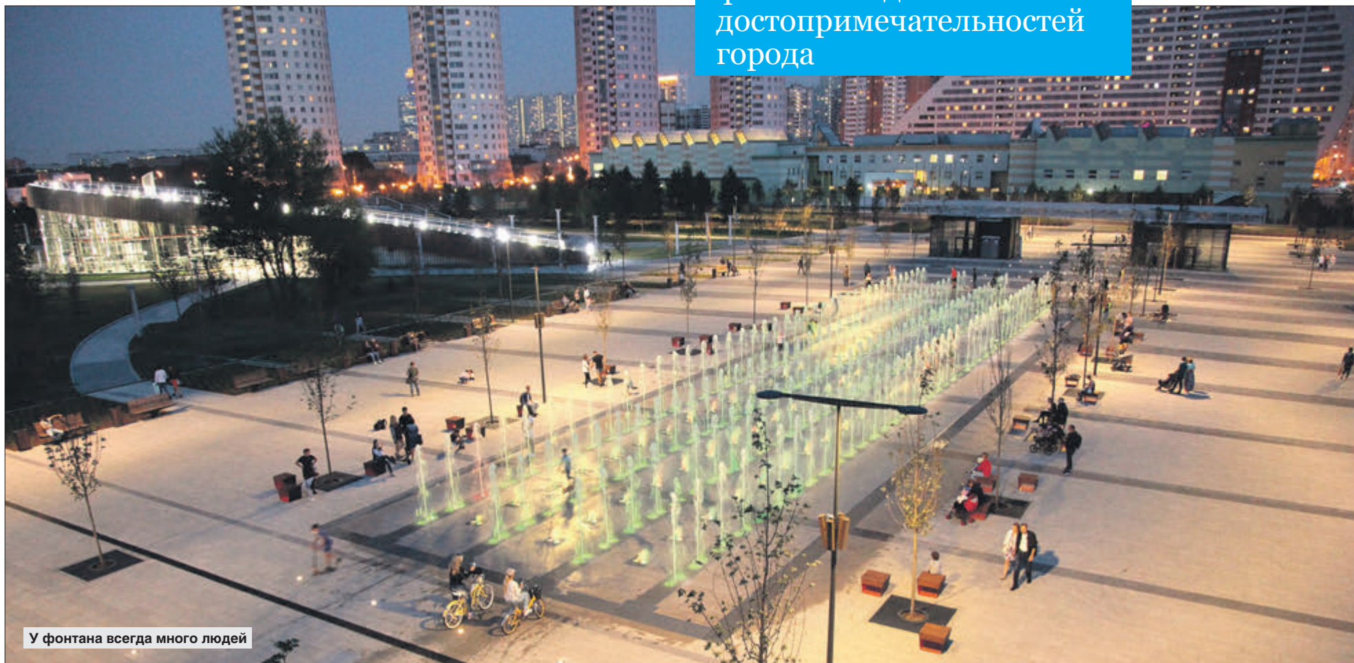
У фонтана всегда много людей

Светомузыкальный фонтан — одна из главных достопримечательностей города