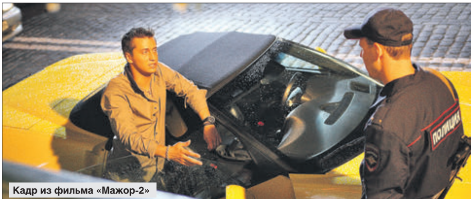
Кадр из фильма «Мажор-2»

— Мой герой из тех людей, которые не умеют красиво и убедительно говорить. Ему легче ударить, чем решать спорный вопрос мирным путём. Я полагаю, что людям,