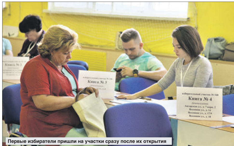
Первые избиратели пришли на участки сразу после их открытия

Ещё избирателей участка в школе №236 бесплатно угощали кашей и чаем с полевой кухни.