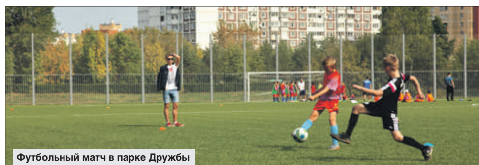
Футбольный матч в парке Дружбы

Он учится в кадетской школе, мечтает стать лётчиком и прыгнуть с парашютом.