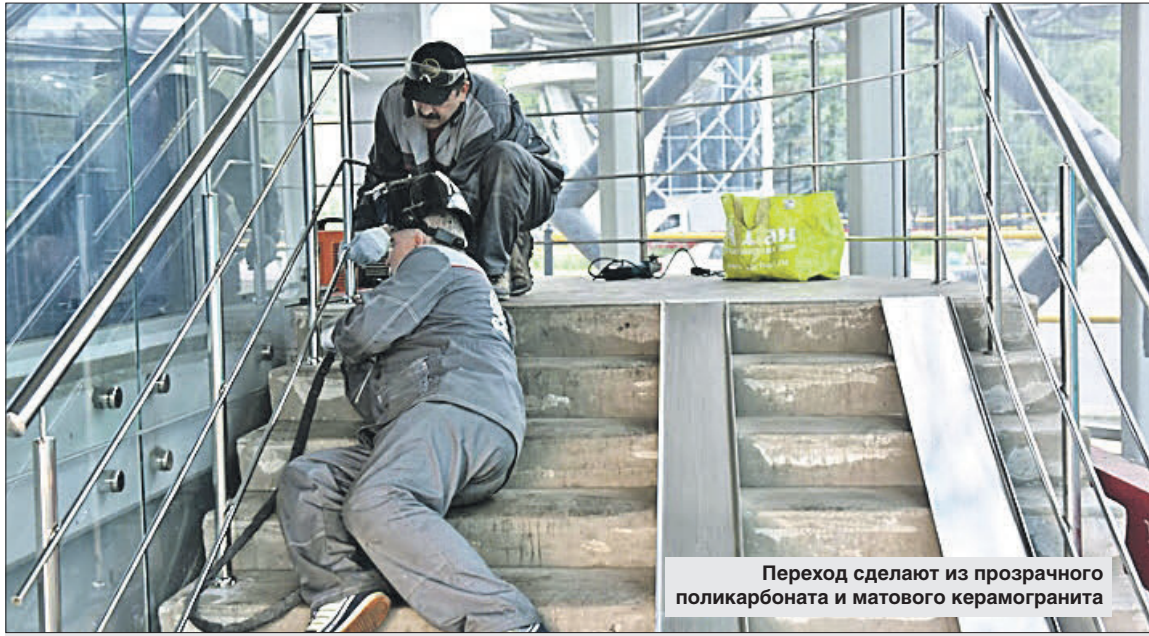
Переход сделают из прозрачного поликарбоната и матового керамогранита