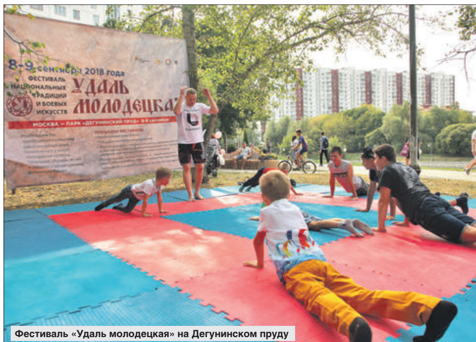
Фестиваль «Удаль молодецкая» на Дегунином пруду