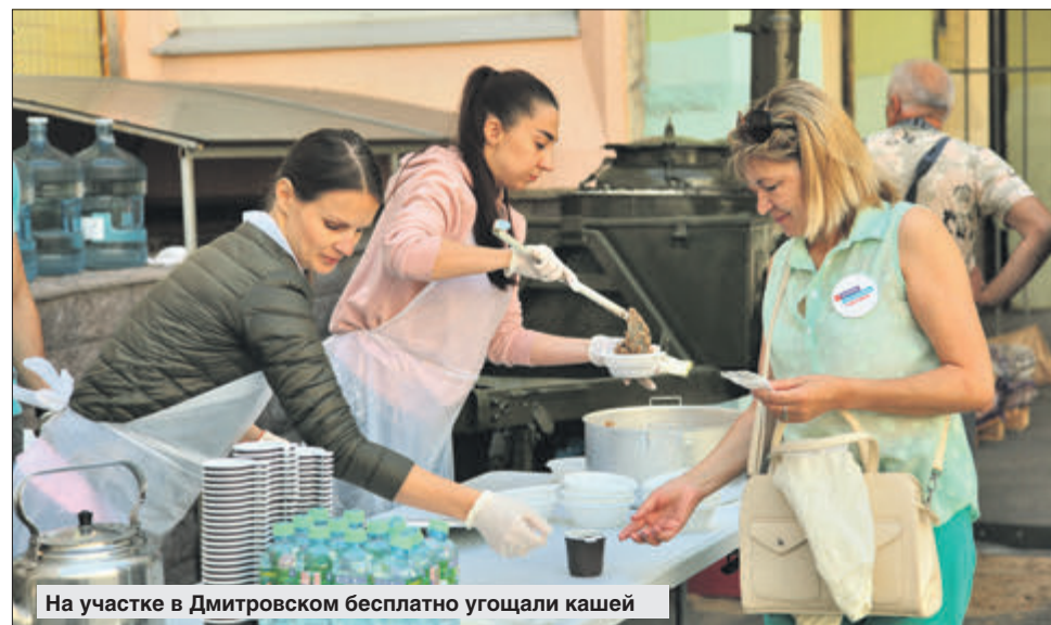
На участке в Дмитровском бесплатно угощали кашей