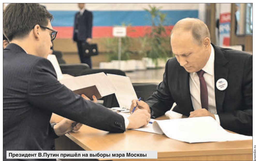
Президент В.Путин пришёл на выборы мэра Москвы

На каждый избирательный участок были направлены наблюдатели от Общественной палаты г. Москвы, до этого они