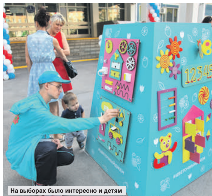
На выборах было интересно и детям

хом, геранью и бархатцами. Получилось красиво.