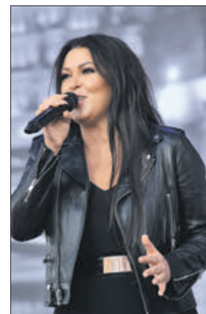
Песню победителя «Фабрики звёзд» Ирины Дубцовой зрители встретили овацией

Самой масштабной площадкой округа стали Ангарские пруды. Здесь поставили грандиозную сцену, где весь день шёл концерт. Поздравили гостей именитые российские артисты, например победительница «Фабрики звёзд» Ирина Дубцова, встреченная бурей оваций. Вокруг сцены разместились «творческие аллеи» с выставками фотографий и хендмейд-суве-