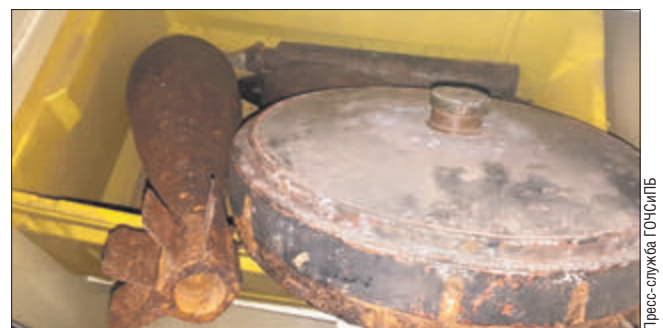
Мины Второй мировой хоть ржавые, но по-прежнему опасные