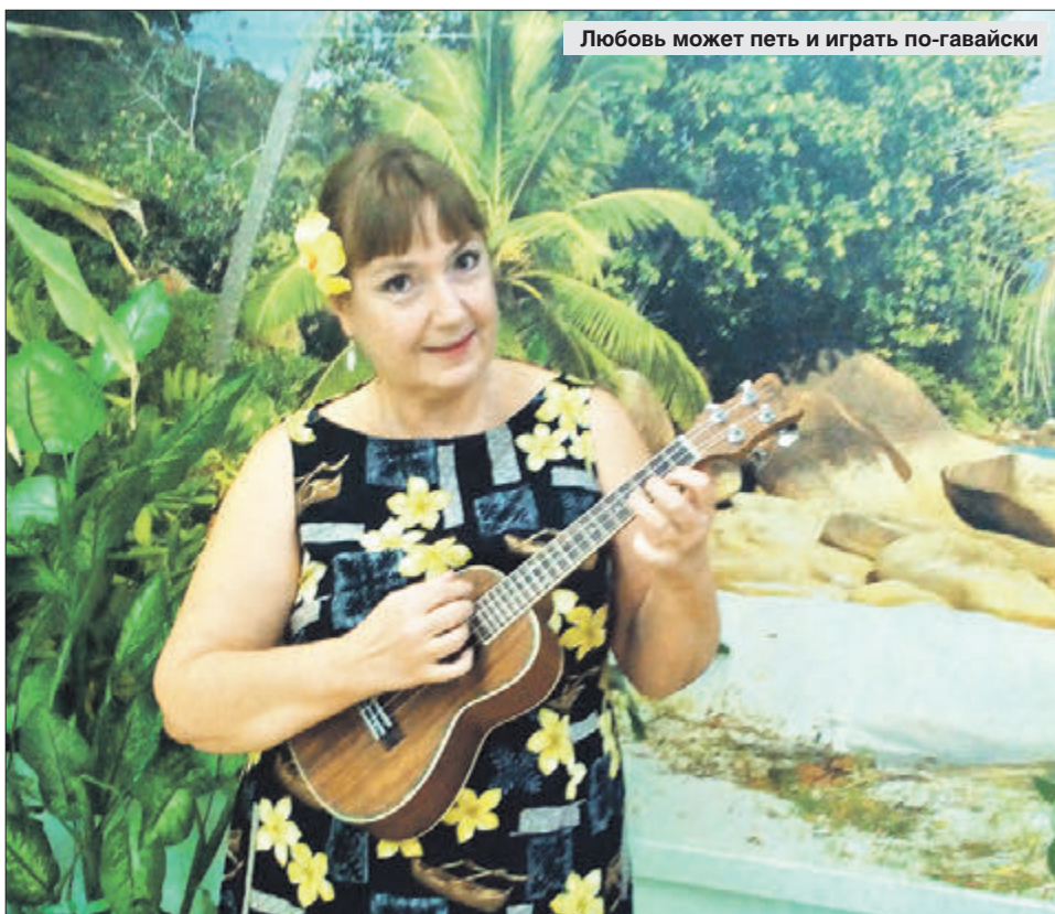
Любовь может петь и играть по-гавайски

— Я окончила Университет управления, про-