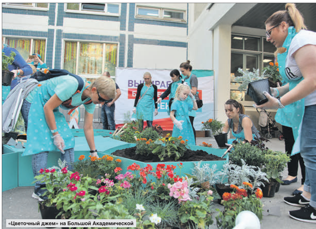
«Цветочный джем» на Большой Академической