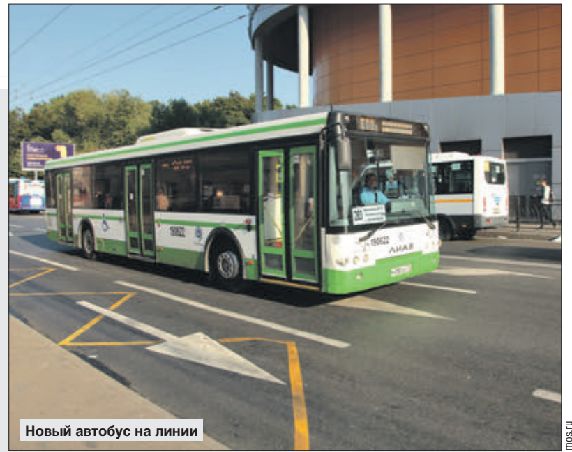
Новый автобус на линии