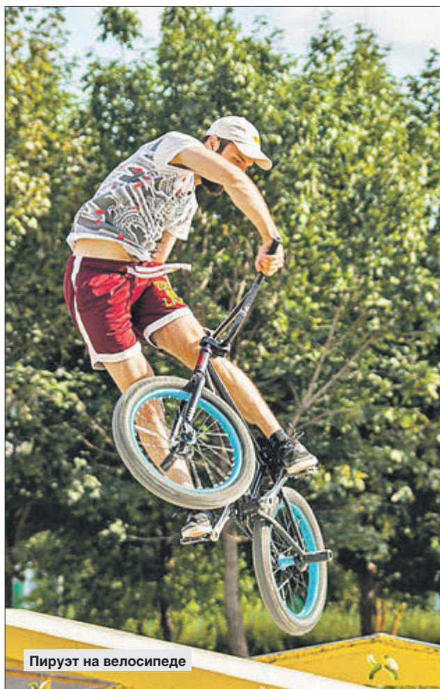
Пируэт на велосипеде