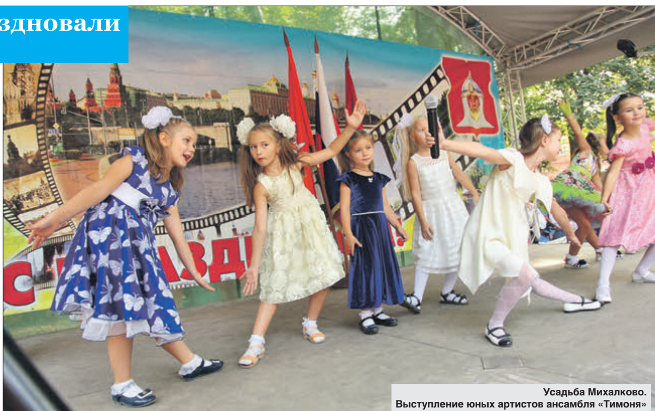
Усадьба Михалково. Выступление юных артистов ансамбля «Тимоня»