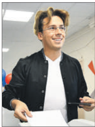
Артист М.Галкин на избирательном участке

Кульминацией фестиваля «Цветочный джем» стал масштабный конкурс любительских цветников. Москвичи воплотили свои ландшафтные идеи на районных площадках праздника. После этого зрители