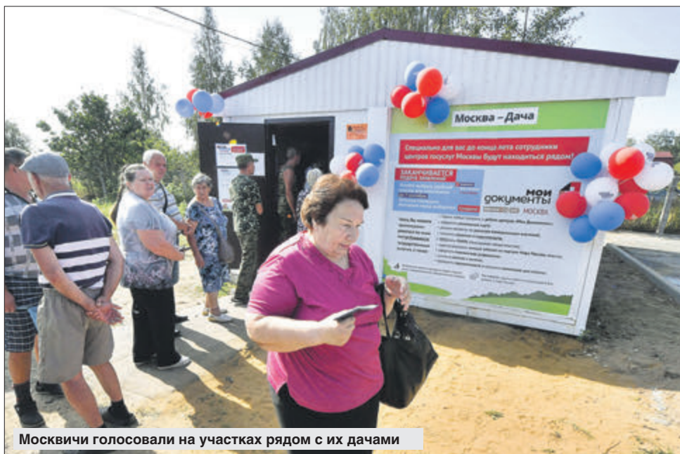
Москвичи голосовали на участках рядом с их дачами

На загородных участках наблюдался настоящий ажиотаж