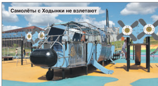
Самолёты с Ходынки не взлетают