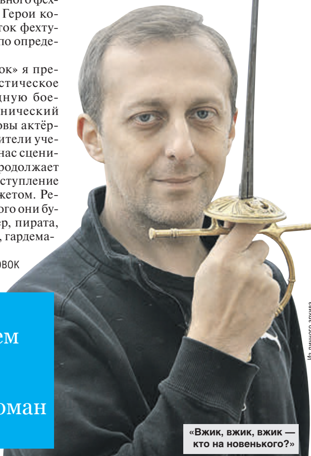
«Вжик, вжик, вжик — кто на новенького?»

Увлечение фехтованием началось с попытки написать роман о пиратах