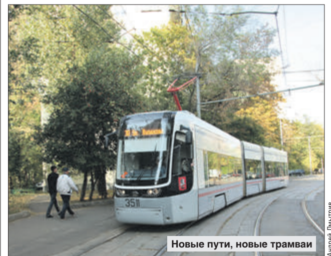
Новые пути, новые трамваи

Трамвайные пути в 3-м Михалковском переулке отремонтировали