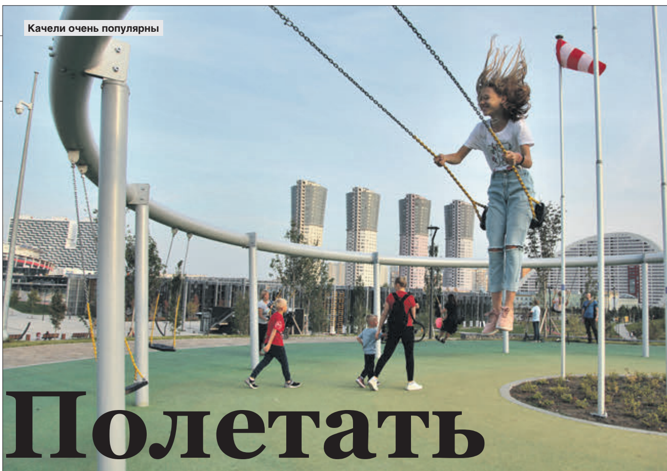
Качели очень популярны