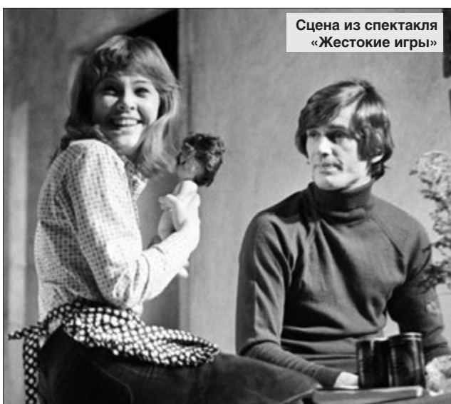
Сцена из спектакля «Жестокие игры»

В конце 1950-х — начале 1960-х известный советский драматург жил на улице Черняховского