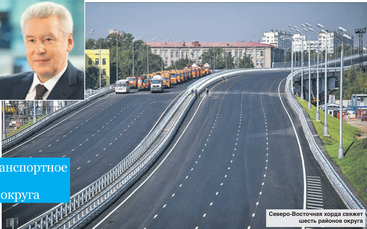
Северо-Восточная хорда свяжет шесть районов округа