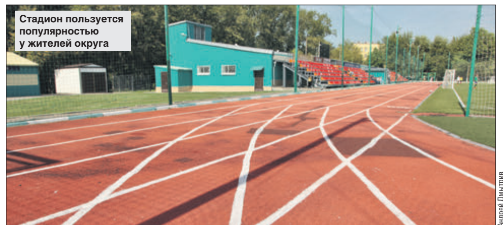
Стадион пользуется популярностью у жителей округа

На территории стадиона расположены крытый бассейн, ледовый дворец, хоккейная коробка и футбольное поле. На территории чисто и аккуратно. В небольшой хоккейной коробке шла тренировка юных футболистов. Родители стояли у бортов коробки или же сидели на траве, потому что скамеек здесь нет. Неподалёку находится большое футбольное поле. Рядом с ним — трибуны без навесов. Видно, что