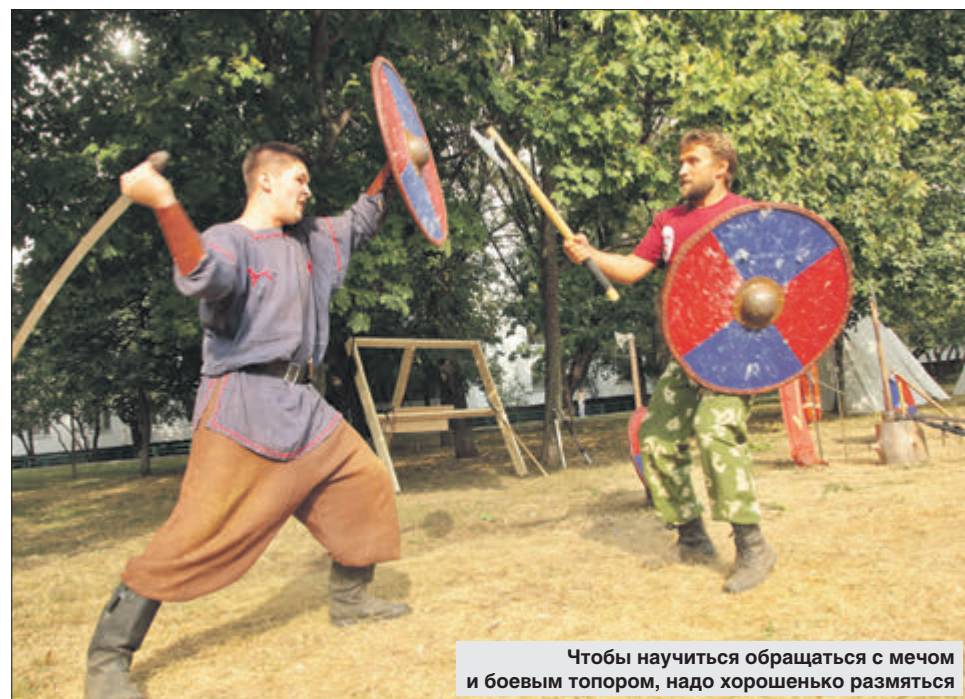
Чтобы научиться обращаться с мечом и боевым топором, надо хорошенько размяться