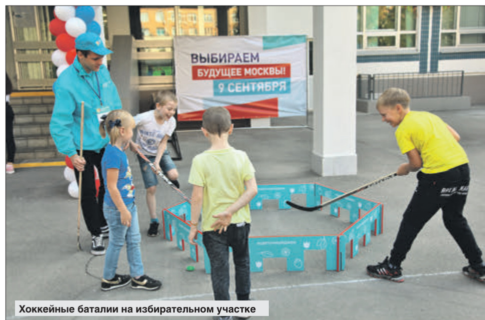
Хоккейные баталии на избирательном участке

Для детворы около избирательных участков были организованы игры. Мальчикам больше всего