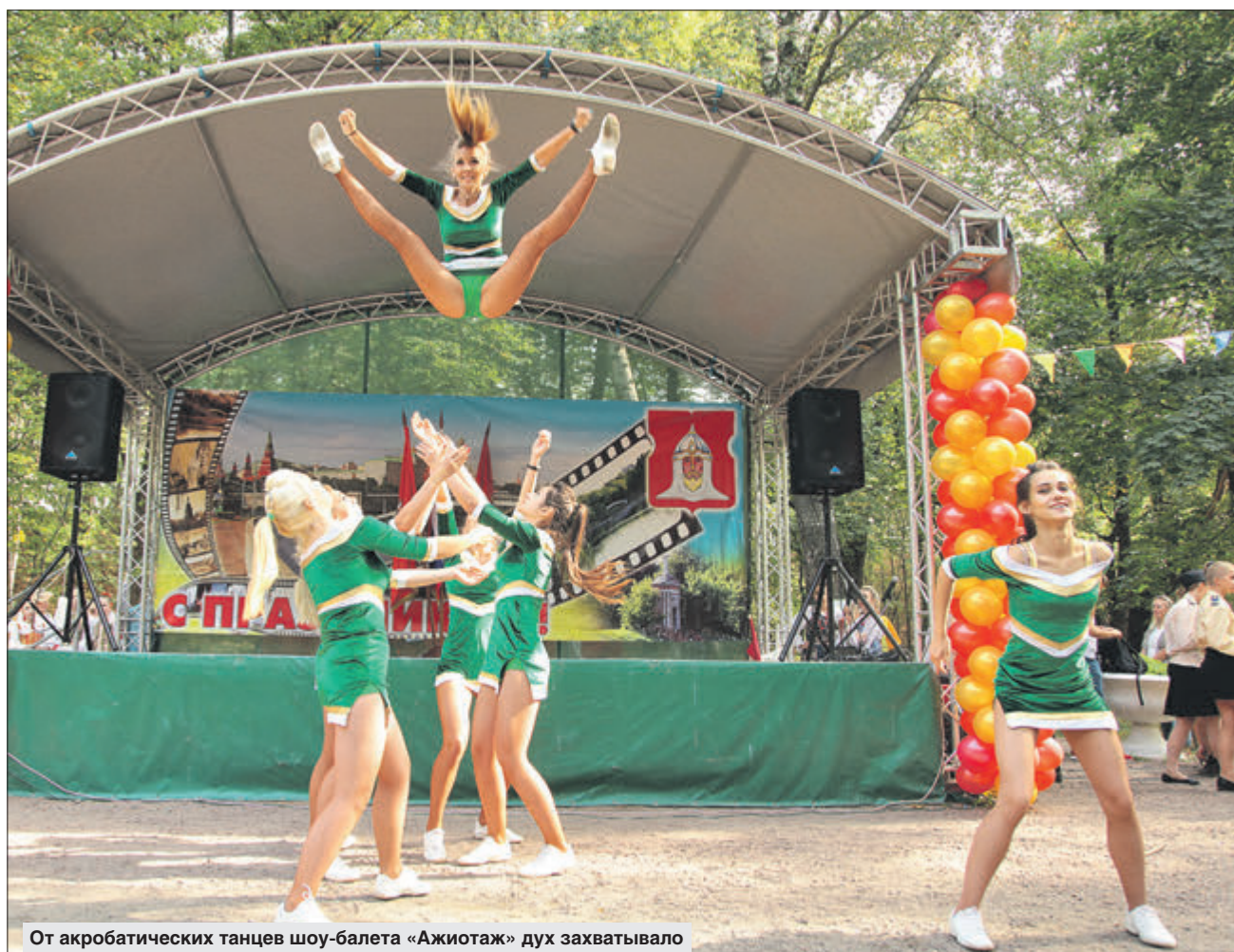
От акробатических танцев шоу-балета «Ажиотаж» дух захватывало