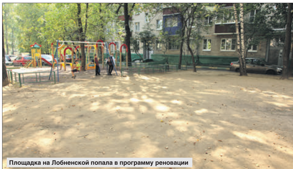
Площадка на Лобненской попала в программу реновации

Кроме того, в любом случае выполнить работы по обустройству поля для игры в футбол