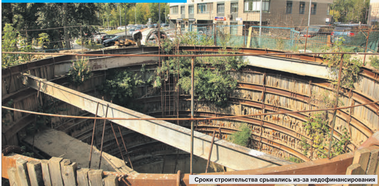
Сроки строительства срывались из-за недофинансирования

Коммуникации предназначены для новостроек на Левобережной улице